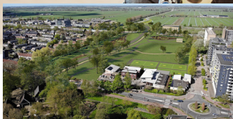
Noord-Zuidverbinding pag. 2