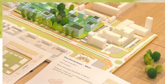
Binnenstedelijke Herstructurering Sliedrecht pag.1