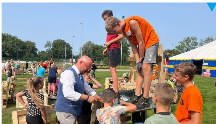
De Knotsweek was weer een succes.