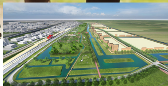
Sliedrecht Noord pag. 3