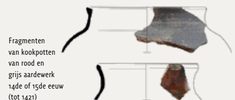
Fragmenten van kookpotten van rood en grijs aardewerk 14de of 15de eeuw (tot 1421)