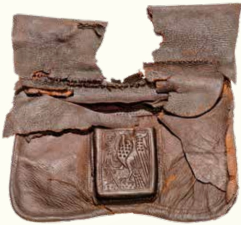
Gordeltas, zool en houten onderschoen (trip)