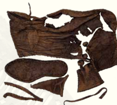
Eén van de babyschoentjes zoals opgegraven