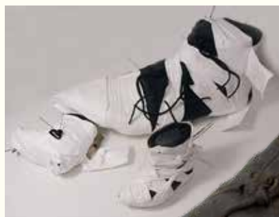
Hoge schoen tijdens en na restauratie