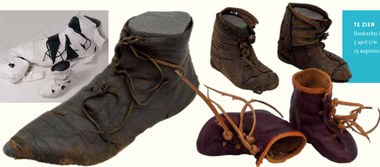
Originele baby-schoentjes uit de 14de eeuw met daaronder nieuw gemaakte replica's