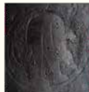
Grappige details op 14de-eeuwse messcheden en een bovenarmbeschermer.