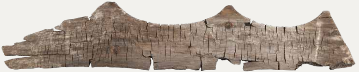
Fragment van een houten sierlijst van het dak van het huisje.

A. van der Laan, Het breien der haringnetten , 1716-1742, gravure (detail), Fries Scheepvaart Museum, Sneek. Bij de rode pijl is een vergelijkbare sierlijst langs het dak te zien.