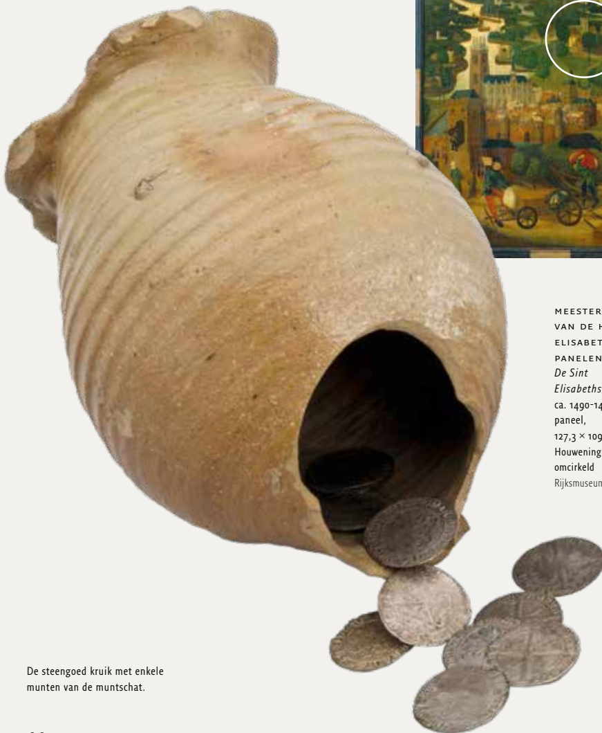
De steengoed kruik met enkele munten van de muntschat.