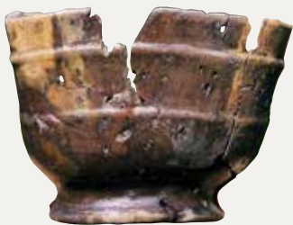
Een houten kom en een kookpot (grape) van rood aardewerk, gevonden in het vakwerkhuisje.