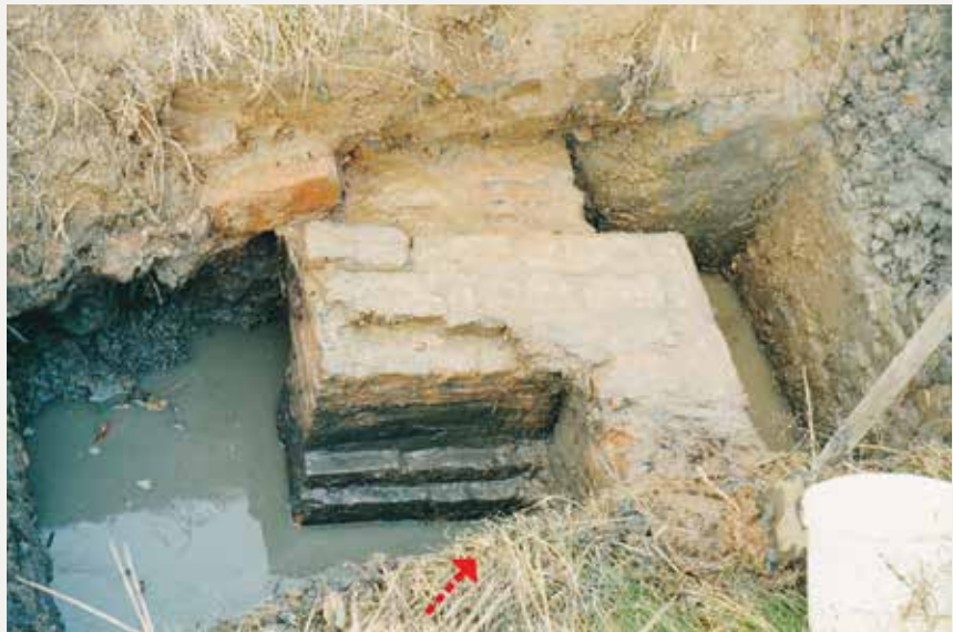
Muurwerk van het vakwerkhuisje. In de hoek bij de rode pijl werd de muntschat gevonden.