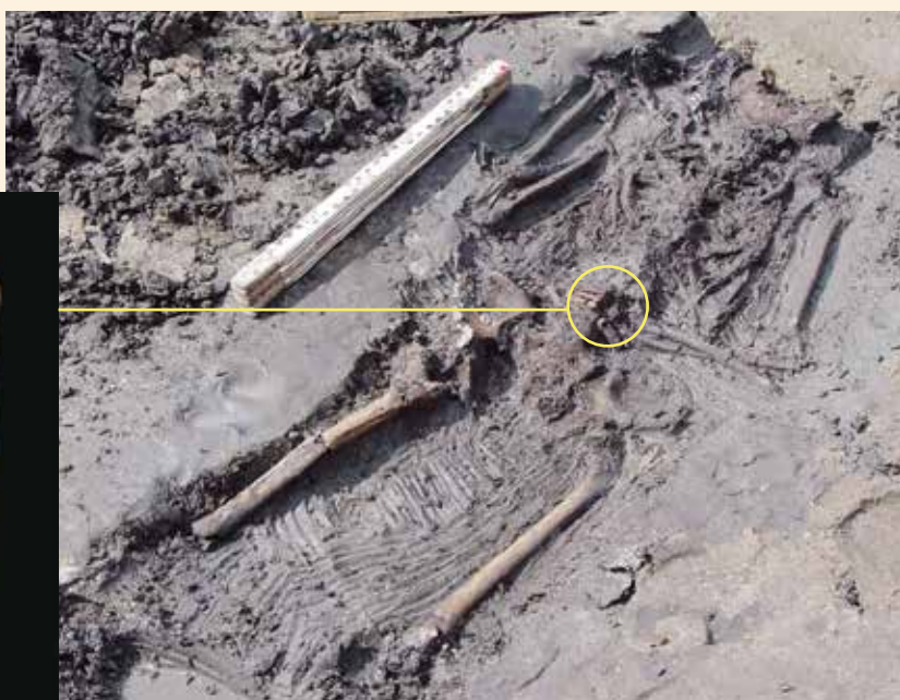
Het skelet van de vrouw die tussen 416-540 na Chr. op de zuidelijke oeverwal van de Dubbel woonde

De oeverwal van de rivier de Dubbel was ook in de Romeinse tijd al bewoond: op honderd meter ten westen van dit graf is vorig jaar een Romeinse woonlocatie uit de 2de en 3de eeuw opgegraven. Mogelijk is hier dus sprake van continue bewoning, vanaf de Romeinse tijd tot de Sint-Elisabethsvloed. Om dit uit te zoeken wordt het skelet momenteel verder onderzocht. Met isotopenonderzoek wordt bepaald of de vrouw in de directe omgeving is geboren en opgegroeid. Met DNA-onderzoek kan haar DNA-profiel mogelijk worden toegeschreven aan een specifiek gebied in Europa, zoals het gebied waar de Romeinse bewoners – mogelijk veteranen uit het Romeinse leger – vandaan kwamen. We wachten in spanning op de resultaten. Waar komen de oudste Dordtenaren vandaan? <