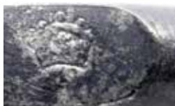
Zilveren rinkelbel, opgraving Lindershof, Bagijnestraat 1-3

Archeologen van de gemeente Dordrecht deden vorig jaar februari een bijzondere vondst. Tijdens een opgraving op het binnenterrein van het voormalige warenhuis Lindershof aan de Bagijnestraat stuitten zij op een rinkelbel: kinderspeelgoed met aan de ene zijde een zilveren fluitje en aan de andere zijde een benen bijtstuk.