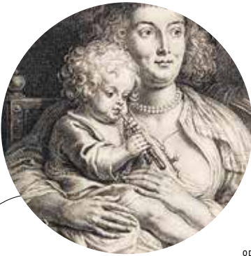
Detail van baby op schoot die op het fluitje blaast van een rinkelbel.