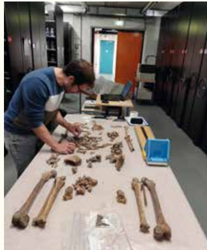
De graven die werden aangetroffen bij de opgraving van het Minderbroedersklooster.