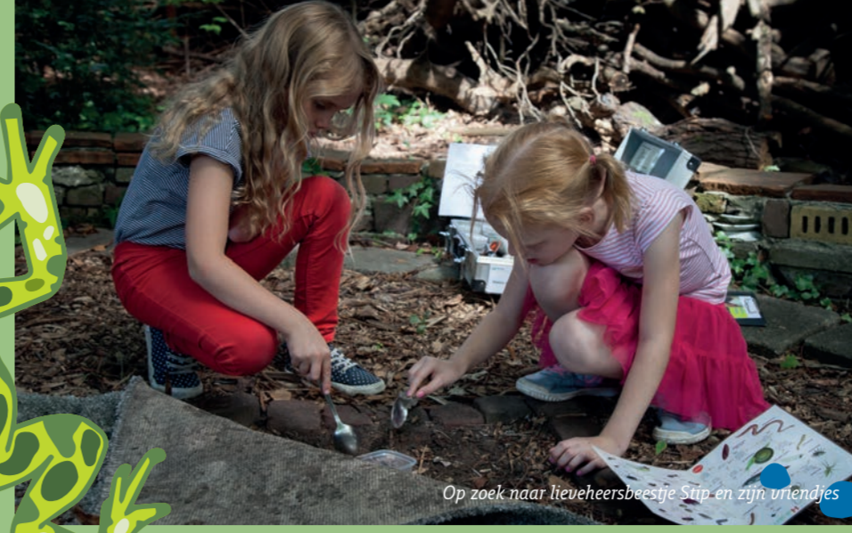
Op zoek naar lieveheersbeestje Stip en zijn vriendjes

Sporen zijn niet alleen pootafdrukken in de grond. Ga mee op zoek naar prenten, gallen, vrant- en graafsporen... en nog veel meer!