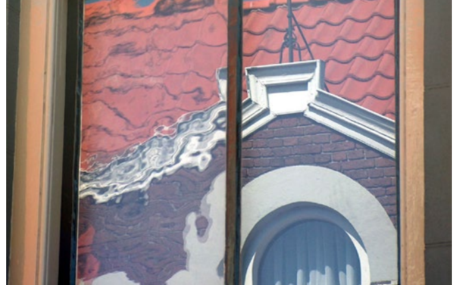
Vervanging van oorspronkelijk mondgeblazen glas (links) door modern glad floatglas (rechts), beide in een oud raam. Vergunning nodig.