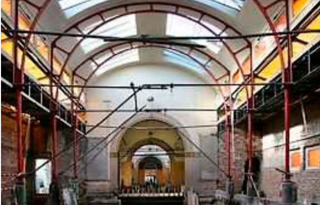
Volledig cascoherstel. Vergunning nodig.