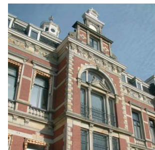
Eén van de indrukwekkende gevels