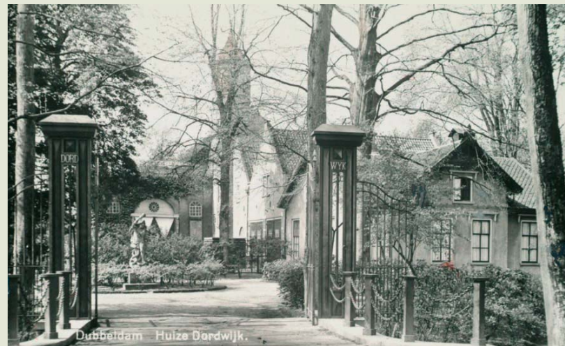
Huize Dordwijk, Dubbeldam, begin 20ste eeuw

De landelijke omgeving van de stad werd vastgelegd door schilders als Cuyp, Schouman en Van Strij. Uiteraard ziet op deze schilderijen bijna alles er zonnig, groen en vredig uit. Ook al voordat de Romantiek als schilderij begon, waren de landschappen doordrenkt van het romantische ideaal van een ongerepte natuur met hier en daar koeien, een eenvoudige herder of boer. Maar ook al zijn die voorstellingen wellicht wat optimistisch van toon, het is toch goed voorstelbaar hoeveel ruimte en rust er toen heerste buiten de stad. Zeker in een tijd waarin het leven in de stad erg ongezond kon zijn door besmettelijke ziektes, ongedierte en afval van allerlei aard, moet het een verademing zijn geweest om langere periodes naar buiten te kunnen trekken in de frisse buitenlucht en de in stilte te kunnen genieten van een glas wijn, een pijpje en een mooie Franse roman. Ook hielden eigenaars van buitenplaatsen zich bezig met het kweken van allerlei soorten planten, een vervolg op in de 17e eeuw ontstane verzamelingen van rareiteiten, waaronder ook exotische bomen, bloemen en kruiden. Bij heel wat buitenplaatsen stond een orangerie, waar subtropische gewassen werden gekweekt.