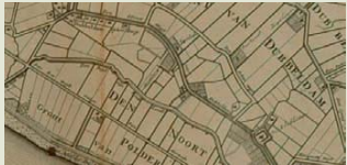
Detail van de kaart van 't eiland van Dordrecht uit ca. 1673 met Dubbeldam. Op deze plattegrond van Mattheus van Nispen is het noorden naar het zuiden afgebeeld.