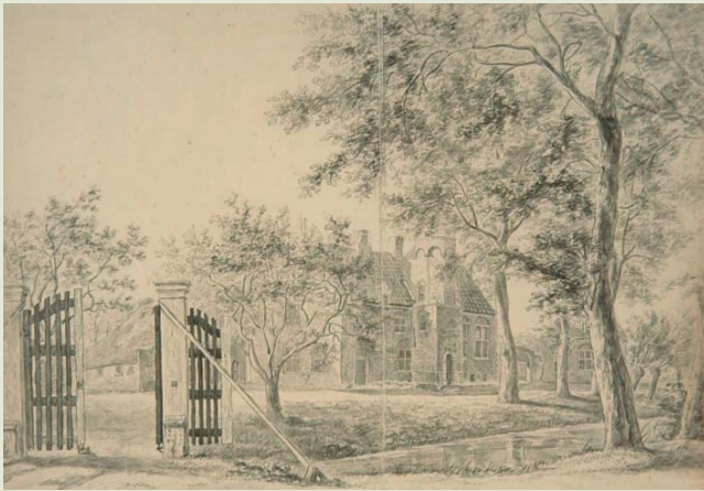
Buitenplaats Crabbheff was een landhuis met een boerderij gelegen in de Zuidpolder. Raadsheer Johan Diderik van Slingeland was de eigenaar in de achttiende eeuw. Hij had ook een huis aan de Nieuwe haven.

woonde de ongehuwde mevrouw Everwijn nog met broer en zuster aan de Wijnstraat. Naast de buitenplaats beschikten ze over drie bedienden en een koets met twee paarden. Zo is door de geringe tijdsperiode tussen 1731 en 1742 een vrij grote continuïteit aanwijsbaar. Er kan daarmee een beeld worden opgeroepen van de elite, hun woningen buiten en in de stad, in samenhang met tekeningen, schilderijen enkele plattegronden en het verloop van hun financiële positie.