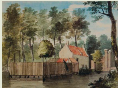
De menagerie en entree van buitenplaats Wieldrecht, Aart Schouman, 1747