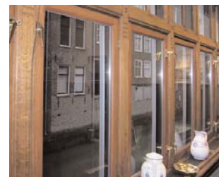
De stijlkamer aan de haven