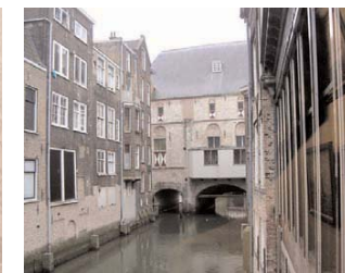
Zicht op de Voorstraatshaven