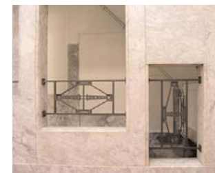
Doorkijk naar de keldertrap