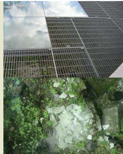
De toegedekte resten van de fundamenten van de beulstoren (tweede helft 14 e eeuw)