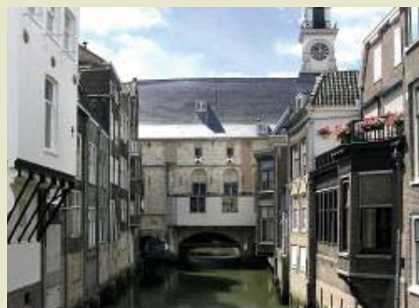
Als Stadhuis in gebruik sinds 1544, middeleeuwse gevelreconstructie uit 1983, gezien vanaf de Visbrug.