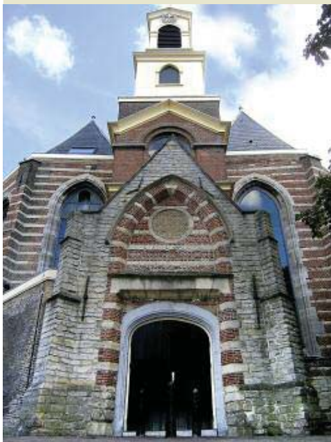
Een kijkje in de keuken. Van de op één na oudste kerk van Dordrecht: de Nieuwe of Sint Nicolaaskerk (1500/1568)