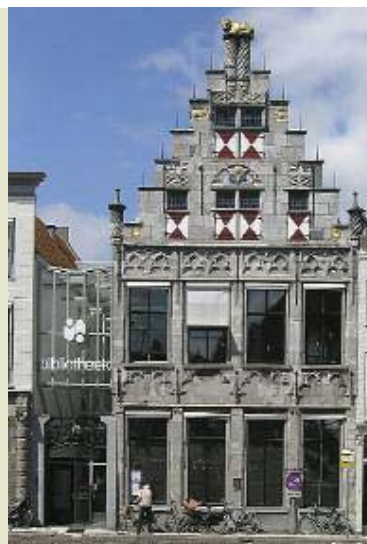
Groenmarkt 153: De Vergulde Os (1516). Vanaf zijn hooggelegen positie overziet de gouden os al eeuwenlang de stad.