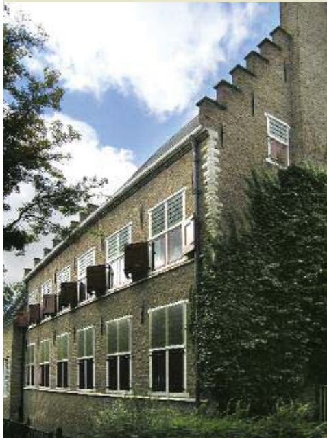
De Statenzaal van het Hof vanuit de Kloostertuin