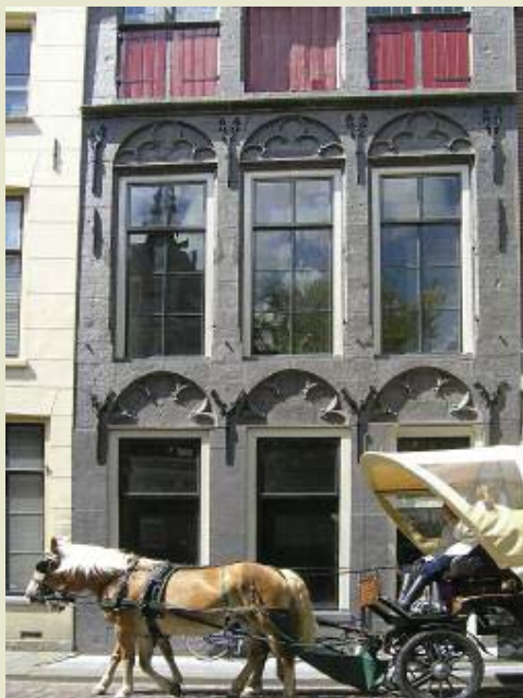
Wijnstraat 113: 't Zeepaert (1495). In de 16 e eeuw woonden en werkten hier diverse zeepzieders