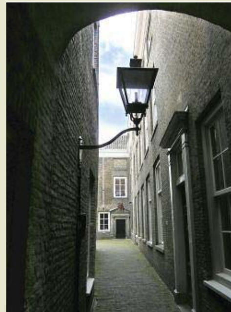
Tussen 1367 en 1806 de Munt van Holland