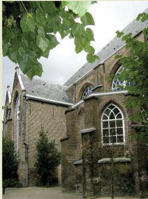
De Augustijnenkerk , in de 15 e eeuw gebouwd als kloosterkerk, in 1618-1619 gastheer voor de Nationale Synode