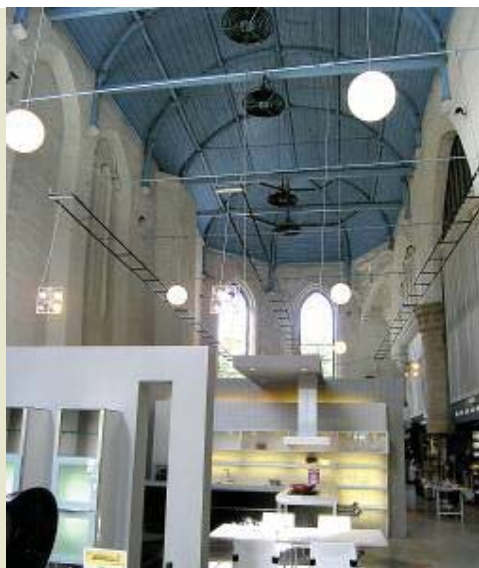
Een kijkje in de keuken. Van de op één na oudste kerk van Dordrecht: de Nieuwe of Sint Nicolaaskerk (1500/1568)