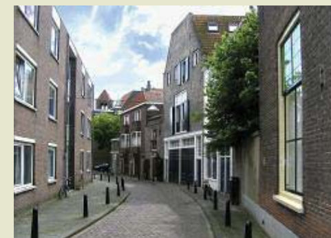
Suikerstraat: in 1572 de gebogen verlopende grens van de stad Dordrecht.

Wij zagen het toch, de stad aan de viersprong der stromen en overal de snippers van Gothiek?