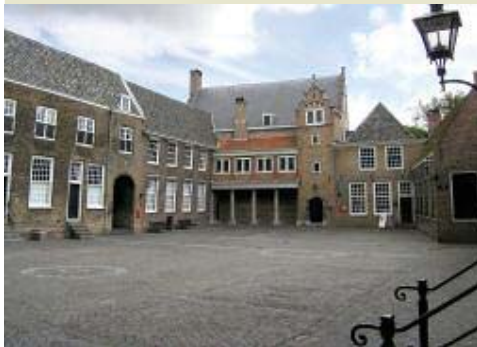
Het Hof (inmiddels gewijzigd) decor van de Eerste Vrije Statenvergadering van de Hollandse steden in 1572