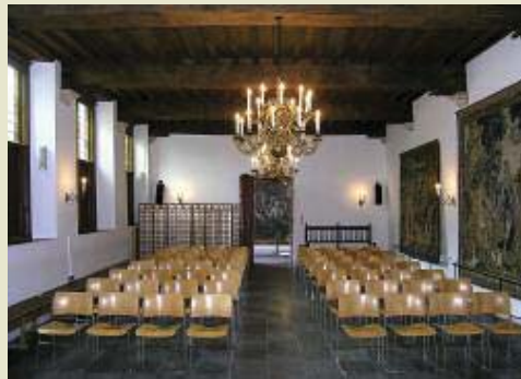
De Statenzaal ooit de refter van het Augustijnenklooster, in 1572 de vergaderzaal