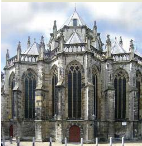
De Grote of Onze Lieve Vrouwekerk (1366 e.v.): Brabantse gotiek op Romeanse fundamenten in een oer-Hollandse stad