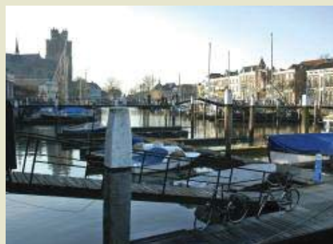
Het Nieuwe Werck: een onbebouwde landtong in 1572