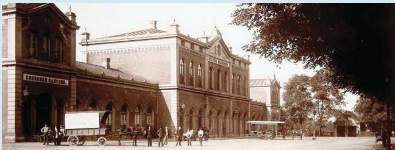
Voorzijde van het station, ca. 1920.

De voormalige Dordtse stationskapperszaak, nu in het Spoorwegmuseum in Utrecht.