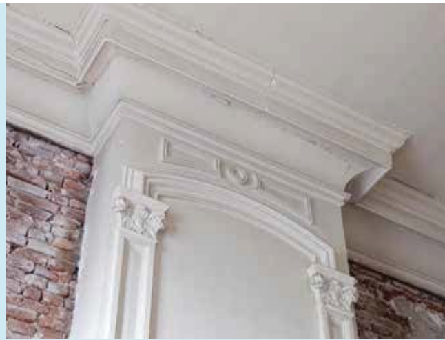
Prachtige acanthusbladeren in de kapiteeltjes van de schouw in de zitkamer.

Voor dit artikel is gebruik gemaakt van het bouwhistorisch rapport 'Station Dordrecht Cultuur-historische verkenning en waardstelling' van SteenHuisMeurs uit 2014.