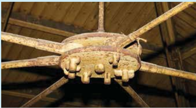
Het dak wordt ondersteund door zogenaamde Belgische spanten; een gietijzeren constructie.

verlaagde plafonds verborgen zijn. In de slaapkamer bevinden zich aan weerszijden van de schouwboezem nog houten wanden, waar vrijwel zeker inbouwkasten in waren opgenomen.