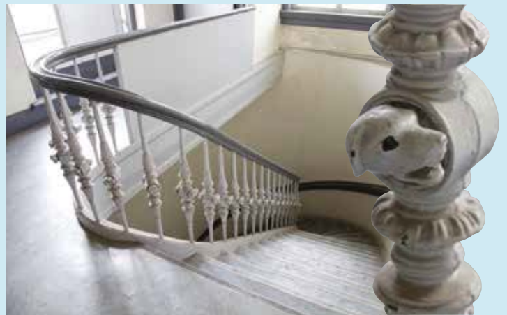
Hondenkopjes in de balusters van de enorme, statige trap.

Opmerkelijk is ook de dienstwoning op de verdieping van het centrale bouwdeel, achter de stationshal. De stationschef bereikte zijn huis vanuit de hal via een majestueuze trap, versierd met tot nu toe onverklaarbare