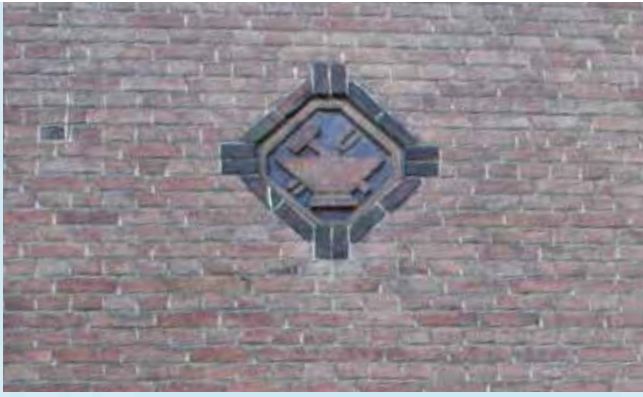
Siermetzelwerk in reliëf en met zwarte klezortjes

In 1918 was de gloednieuwe school aan de Reeweg Oost gereed, ontworpen door de Dordtse architect Bernardus van Bilderbeek. Hij ontwierp een gebouw in rationalistische stijl. De detaillering is een ode aan het ambacht: met zorg uitgevoerd siermetzelwerk, stijlvolle lantaarns en sierlijk smeedwerk. Van Bilderbeek wist ambacht en kunst perfect te combineren. In de gevel worden alle ambachten gedemonstreerd.