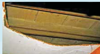
Doorkijkje achter drie verlaagde plafonds: middeleeuwse balken, afgewerkt met een dubbele bies.

De middeleeuwse zoldering van moer- en kinderbinten liet hij zitten. Hij liet het plafond alleen opnieuw schilderen in een grijs-groene kleur, afgewerkt met een rood biesje. Maar in de 18de eeuw