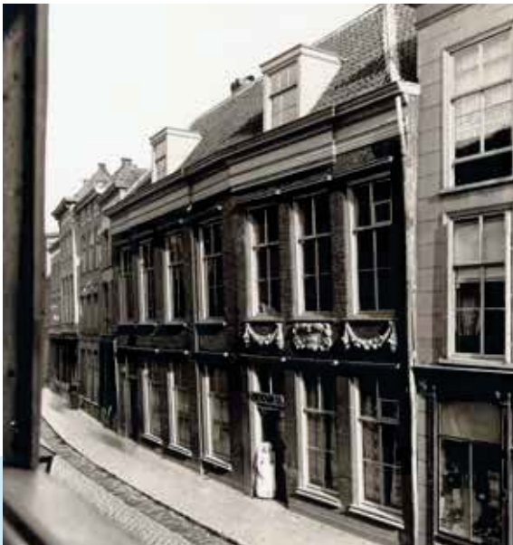
De Blije Hoek, ca. 1900