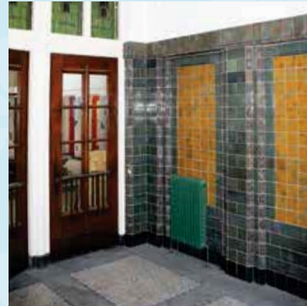
Hoge tegellambrisering en terrazzovloer met mozaïektegeltjes