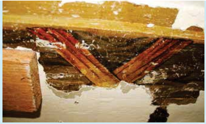
Deze plafondschilderingen kwamen tevoorschijn achter een systeemplafond en een witte verflaag.

liet beide huizen helemaal slopen. Hiervoor in de plaats bouwde hij één breed huis. Was het broederliefde of gewoon de mode dat zijn voorgevel zo op die van het rechter huis leek? Het onderscheid, een verschil van 12 jaar, tussen beide gevels is anno nu nauwelijks te zien. Als je in dit linker bouwdeel binnenkomt, zie je eerst linoleum, stucmuren en systeemplafonds. Maar direct daarachter zit nog vrijwel het gehele huis van