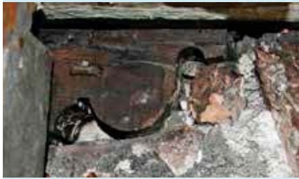
In het achterhuis zit nog één hangbuikconsole, uit ca. 1620.

En het is een verhaal in vier verdiepingen: van de middeleeuwse gewelfde kelder tot de kappen met sporen uit de 15de, 16de, 17de, 18de, 19de én de 20ste eeuw. Wie dus goed kijkt, ziet een bouwgeschiedenis van 500 jaar.