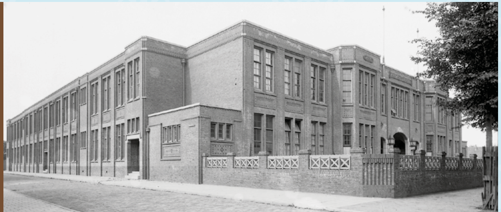
AMBACHTSSCHOOL REEWEG OOST 123