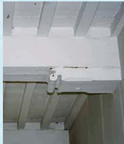
Balkenlaag met moerbalken en kinderbinten en een peerkraalsleutelstuk