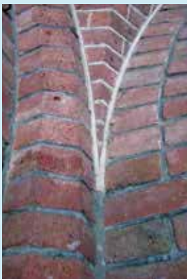
Siermetselwerk, twee kleuren voegwerk