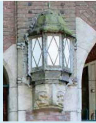
Art Deco lantaarns met beeldhouwde consoles

In de symmetrische voorgevel is het middenportaal een heuse blikvanger. Het ruime portaal heeft een vloer van terrazzo met een mozaïekrandje. Er staan stevige granieten wachtbanken en ook hier weer kundig gemetselde muren en gewelven, met twee kleuren voegwerk. Links en rechts van dit portaal zijn natuurstenen hoekblokken en beeldhouwde consoles onder twee prachtige lantaarns in Art Decostijl. Maar kijk ook goed naar de consoles: op de ene zijn de instrumenten afgebeeld van de timmerman, op de andere die van