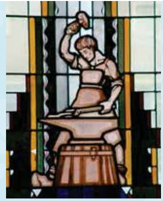
Glas-in-loodraam met afbeelding van een smid

Na de rijke gevel en het wat rustiger portaal betraden de leerlingen de school door twee glasdeuren en een dubbele deur met Art Deco afwerking, in een zwaar kozijn met een boogvormig en fijn gedetailleerd bovenlicht. Een degelijk en fraai stukje timmermanskunst. Hierachter ligt een ruime vestibule. Op de vloer ligt hetzelfde terrazzo-met-mozaïek als in het portaal. De wanden hebben een hoge tegellambrisering van geglazuurde blauwgroene en gele reliëftegels. Het houtwerk van de kozijnen was donker gelakt. Maar na deze wat sombere binnenkomst volgt een licht onthaal in het monumentale trappenhuis. Hier maakte de architect echt een groot gebaar. Met een groots opgezette trap van Duits geelmarmers, dat prachtig aansluit bij de gele betegeling van de muren. Deze tegels hebben vermoedelijk ook elders in de hal gezeten. De diepe en warme kleuren van de oorspronkelijke tegels en het houtwerk waren heel wat sterker dan de huidige fletsblauwe tegeltjes en witte kozijnen. De Art Deco laat zien dat kleur veel kan toevoegen aan een gebouw.