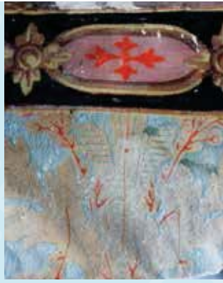
Behangresten, ca. 1830-1850