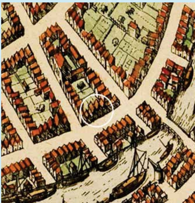
Op een kaart van Braun &amp; Hogenberg uit 1583 staan er nog 3 huisjes, met een gangetje links daarvan.

was dat écht niet meer 'van deze tijd'. De toenmalige eigenaren – nog steeds erfgenamen van dezelfde familie – hingen er een modern plafond onder: houten cassettes, bespannen met lichtblauw geschilderd linnen. In 1920 kreeg het kinderdagverblijf een reprimande van de Inspectie omdat het gebouw niet voldeed aan de moderne hygiëne-eisen voor kinderopvang. Dus kwam er zachtboard onder de cassetteplafonds. Zestig jaar later schreven