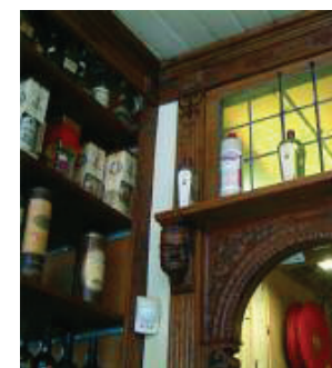
Houtsnijwerk van Bert Stoop