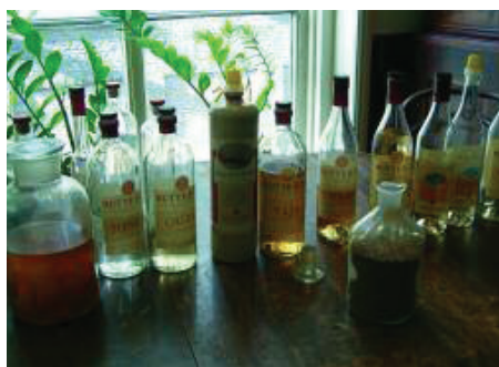
Waar het allemaal omdraait...