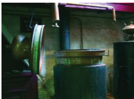
De koperen distilleerketel 'De Vulkaan'