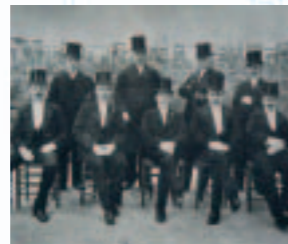
Heren met hoge boeden, één van de vele commissies