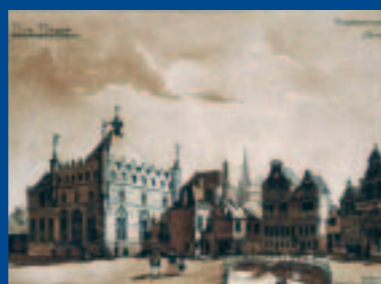
Perspectiefisch aanzicht van het oostelijk gedeelte van Oud-Dordt