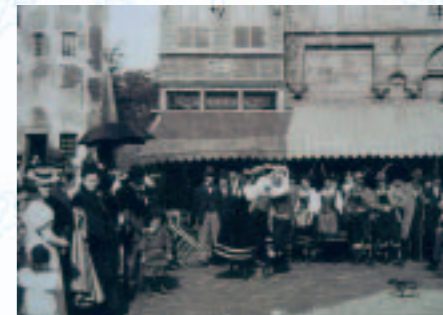
Dansen in Oud-Dordt