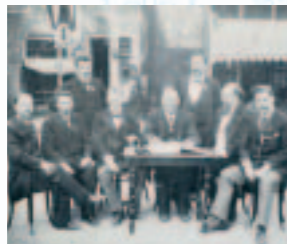
Heren zonder boed; het uitvoerend comité