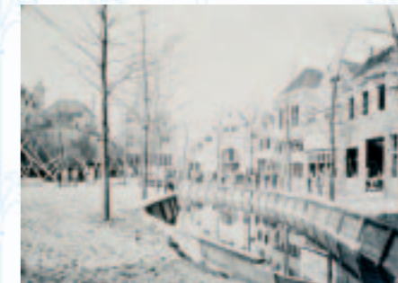
Het begin is er!

Helemaal oorspronkelijk was het denkbeeld van een nagebouwde stad niet, want in de eeuw waarin men de verworvenheden van de industriële revolutie op grote wereldtentoonstellingen vierde, bouwde men wel meer fantasiestadjes voor diverse tentoonstellingen, onder andere in Amsterdam en Antwerpen. Geen vooruitgang zonder nostalgie. Eén ding was zeker: het publiek smulde ervan. Vermaak was echter niet het enige doel van de organisatoren. Oud-Dordt was ook bedoeld om de bezoekers iets te leren over oude bouwkunst en de geschiedenis van Dordrecht. Uit de opzet van de tentoonstelling spreekt de weemoed om het verleden.