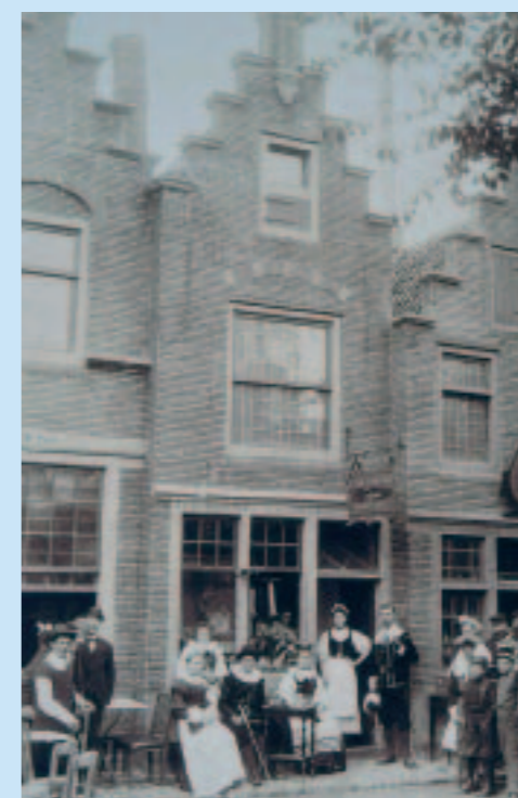
Figuranten en bezoekers van Oud-Dordt