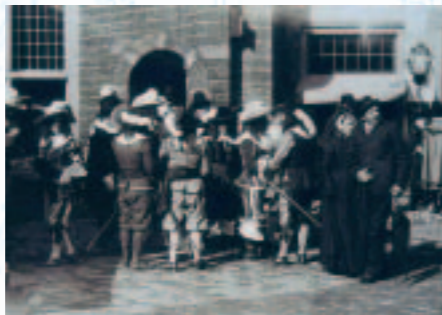
Een echt paar kijkt zijn ogen uit