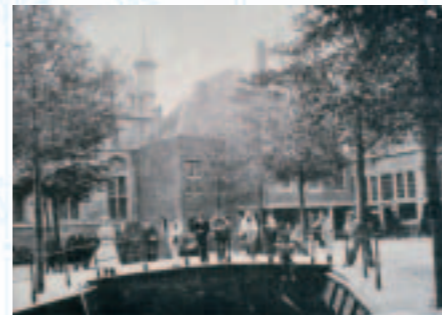
Grachtje kijken in Oud-Dordt; maar zit er water in?