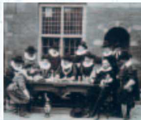
Heren met oude boeden; onder wie enkele leden van het uitvoerend comité