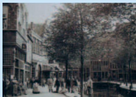
Het Dordtse bouwtype in Oud-Dordt; het huis op de boek