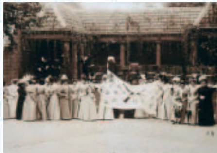
De dag van de opening