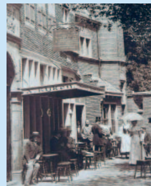
Onder de luifel is het café van Rijken