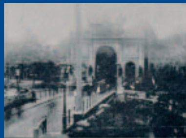
Ereboog ter gelegenheid van het koninginnenbezoek

Voor het koninginnenbezoek had het gemeentebestuur de route vanaf het station naar het stadhuis laten versieren met vlaggetjes, guirlandes, bloemen en strikken. Bij de Johan de Wittbrug prijkte een kolossale erepoort.