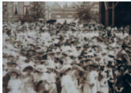
Uitvoering van de kindercantate in juli