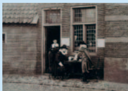
Figuranten in Oud-Dordt