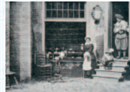
Een toonbeeld van huiselijkheid