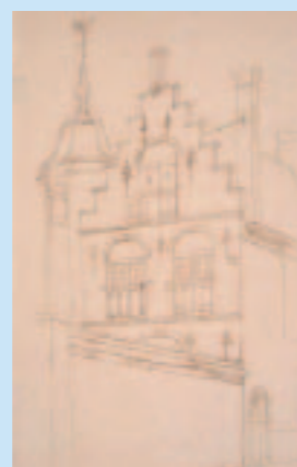
Huisje met schiettoeren << Huisje aan de Voorstraat