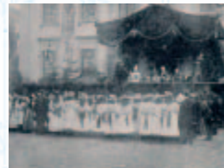
Publiek bij de ontvangst van het gilde van Oud-Antwerpen in Oud-Dordt