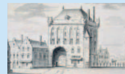
Huijs mette Luiffel