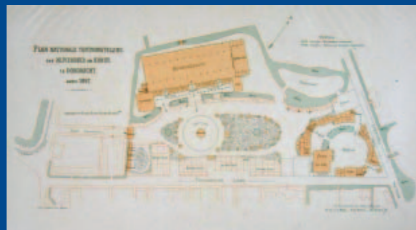
<< Plattegrond van het terrein en de gebouwen van de tentoonstelling

Dit extra katern over het fantasiestadje Oud-Dordt verschijnt ter gelegenheid van het 20-jarig jubileum van de Open Monumentendag.