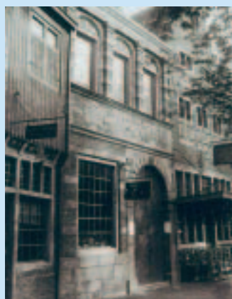
Het Sacramentshuis volgens Oud-Dordt