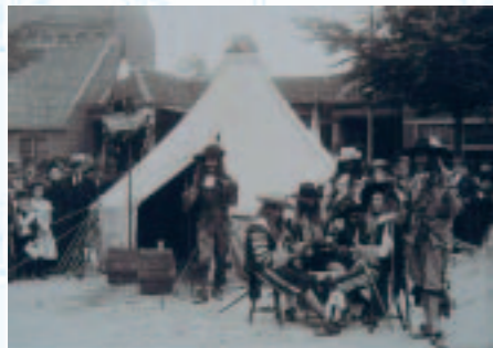
Het venêl rust op fotogenieke wijze uit