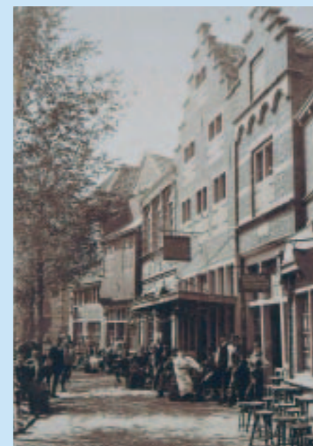
Net naast de boom is de houten gevel te zien, bij Rijken is het goed toeven