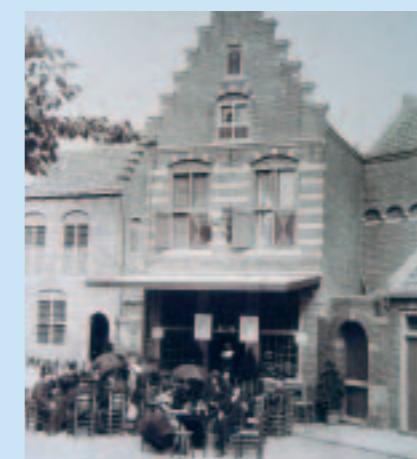
De terrassen van vroeger waren ook niet alles; de dames bebden hun eigen parasols maar meegebracht