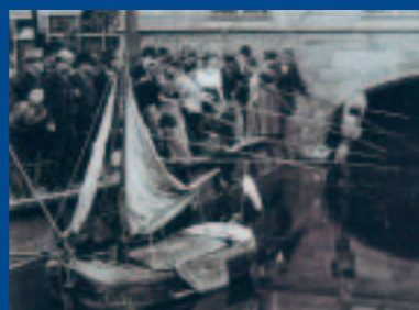
Een viswedstrijd in de gracht; let op de kanjer in de boog van de brug