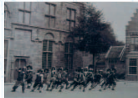
Exercitie van het vendel

Een tentoonstelling over Oud-Dordt is tijdens Dordt Monumenteel te zien in 't Hof te Dordrecht. (vr 8, za 9 en zo 10 september 2006, 12-17uur)