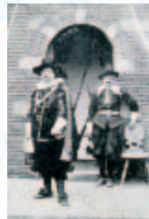
Tijdreizen in de 19e eeuw