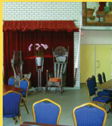
De Lockhorst de foyer