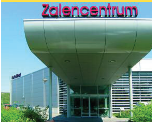
Sliedrecht De Lockhorst