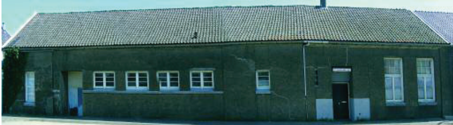
Alblasersdam Biggelmee Vestzaktheater