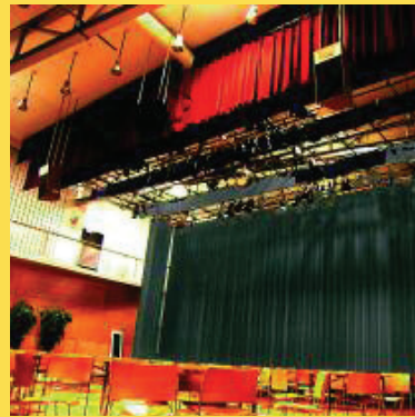
Cascade de zaal