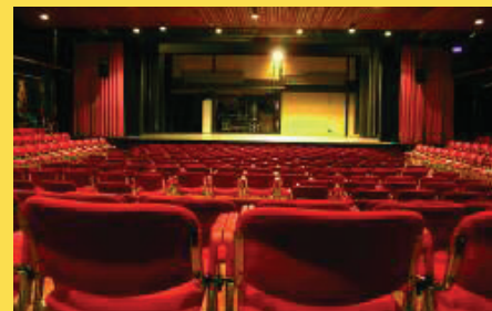
De Willem zaal