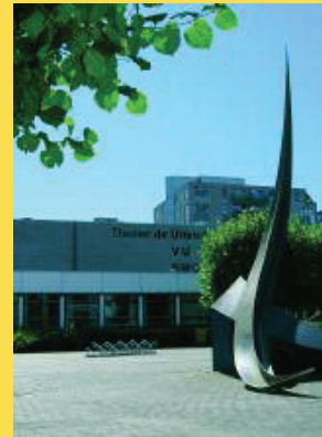
Zwijndrecht De Uitstek