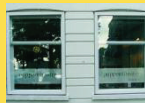
Poppentheater historische poppen