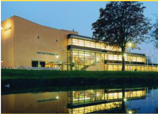
Hendrik Ido Ambacht Cascade