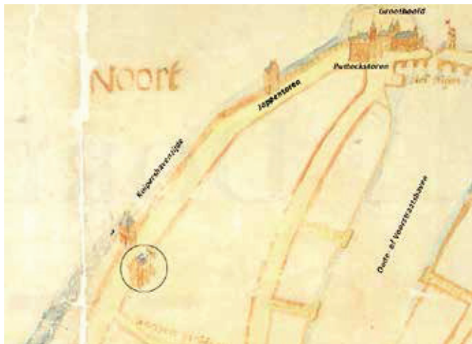
Detail van de kaart door: Jacob van Deventer, 1545

Als er langs de Kuipershaven een stadsmuur heeft gestaan, dan zal deze dichterbij de huidige kade hebben gelegen en niet ter hoogte van de achtergevel van nummer 37-38. Mogelijk is er hier zelfs helemaal nooit een stadsmuur geweest. Op de kaart van Van Deventer is weliswaar een dikke lijn te zien, maar deze wijkt nauwelijks af van de lijnen rond de bouwblokken. Bovendien lijken de torens er bovenop te staan, in plaats van ertussen. Latere kaartenmakers kopieerden vaak van eerdere kaarten en zo slopen er nog wel eens fouten in. Wellicht dat bij een opknabbeurt van de kade meer duidelijkheid komt over wel of geen stadsmuur op deze plek. <