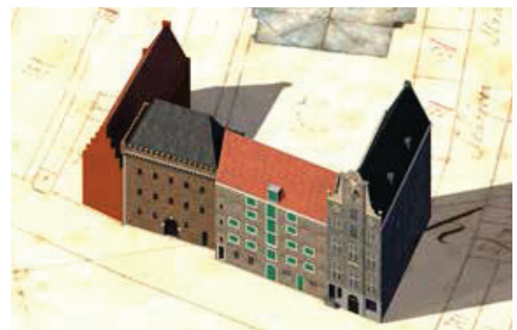
3D reconstructie (P.J. Bosman) van de situatie rond 1700. De toren aan de Kuipershaven is herbestemd tot pakhuis en in het bouwblok opgenomen. In 1903 kwam na sloop van het pakhuis rechts van de toren de rechterkant van de toren weer in zicht.