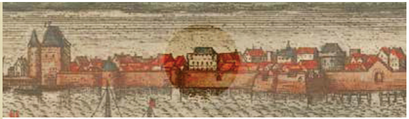
Uitsnede uit het stadsgezicht van Braun en Hogenberg (1575), met in de cirkel de Alaerd van Wijngaerdstoren