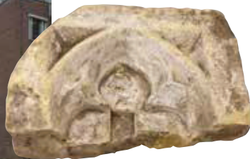
Eén van de boognissen uit het depot