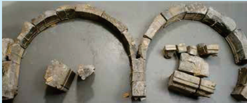
Bogen van de pui van Wijnstraat 54 in depot

Mogelijk was het ooit de bedoeling ze op te nemen in de presentatie van het museum, maar is dit uiteindelijk niet gebeurd of was dit maar van korte duur. Weggevoerd vond men blijkbaar zonde, en in de kelder lagen ze niemand in de weg. Onduidelijk was van welke panden deze fragmenten afkomstig zijn. Navraag bij oud-directeuren van het museum leverde niets op. Gedacht werd aan bebouwing rond het museum, maar een zoektocht op oude foto's leverde niets op. Tot recent bij toeval een foto uit 1891 uitsluitsel bracht: de drie bogen blijken afkomstig te zijn van het pand 's-Gravenhage aan de Wijnstraat, dat in april 1895 samen met het buurpand de Munnik werd gesloopt.