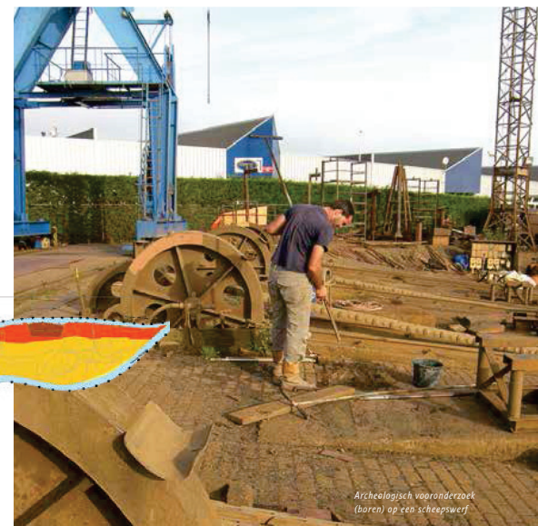
Archeologisch onderzoek (boren) op een scheepswerf

In 2007 trad de Wet op de archeologische monumentenzorg (Wamz) in werking. Deze wet legt de regie bij gemeenten en ziet daarbij het bestemmingsplan als het belangrijkste sturingsinstrument. Dit betekent dat gemeenten bij hun afwegingen rond ruimtelijke plannen ook de mogelijke aanwezigheid van archeologische waarden in de ondergrond moeten meewegen. Eind 2012 heeft Dordrecht het beleid vastgelegd in de beleidsnota en beleidskaart archeologie Dordrecht.