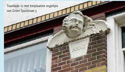
Taankade 12 met herplaatste engeltjes van Grote Spuistraat 5

In de gevel van Taankade 12 zijn bijvoorbeeld de twee gevleugelde engelenkopjes van Voorstraat 5 gebruikt. De gevelsteen met de oioevaar is spoorloos verdwenen en is mogelijk ook aan een particulier verkocht. In de jaren zestig en zeventig is nog een deel herplaatst in de stad, zowel in bestaande gebouwen als in nieuwbouw. De jaartalsteen kreeg een nieuwe plek in de gevel van Hofstraat 8, die weer gebaseerd is op het in 1956 afgebranda pand Grote Spuistraat 5. Van de gevelsteen met de ekster werd een kopie ingemetseld. Engelenkopjes voor in de bogen waren echter niet voorradig; waarschijnlijk is daarom besloten twee medaillons te gebruiken. De rol touw die onderdeel uitmaakte van Voorstraat 7 is ingemetseld bij de Groothoofdspoort.