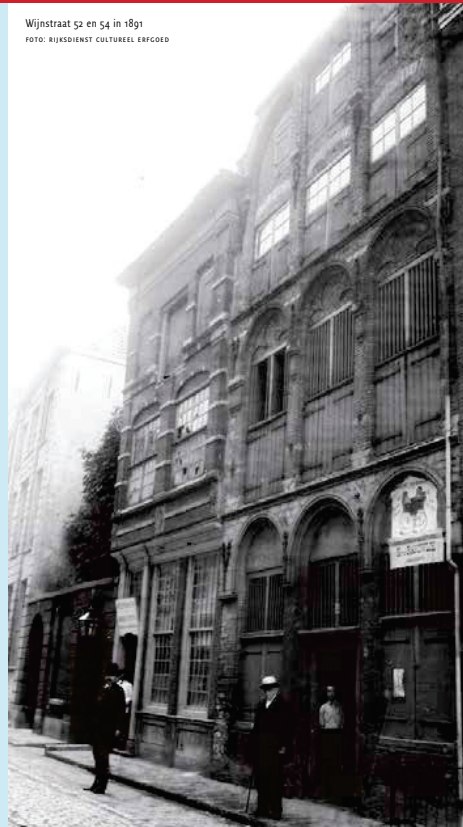
Wijnstraat 52 en 54 in 1891

ZANDSTEEN VERSIERINGEN In 1893 werden de panden Voorstraat 5 en 7 uit 1651 afgebroken. Een deel van de zandstenen versieringen, de guirlandes en klauwstukken kwam terecht in de collectie van Vereniging Oud-Dordrecht. Andere onderdelen werden waarschijnlijk aan particulieren verkocht.