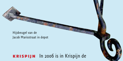
Hijbeugel van de Jacob Marisstraat in depot

KRISPIJN In 2006 is in Krispijn de bebouwing tussen de Jacob Marisstraat en Willem Marisstraat gesloopt en vervangen door nieuwbouw. De oude bebouwing, die tussen 1924 en 1927 in twee fases tot stand is gekomen naar ontwerp van de Dordtse architecten Van Bilderbeek en Reus, is ontworpen in de stijl van de Amsterdamse School. Deze baksteenarchitectuur wordt gekenmerkt door golvende lijnen, grote dakoverstekken en verfijnde detaillering rond entrees, hoeken en gevelbeëindigingen. De blokken zijn in de jaren zeventig gerenoveerd, waarbij veel van de oorspronkelijke details verloren zijn gegaan.