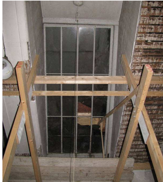
Afb. 13 – houten dakramen orangerie