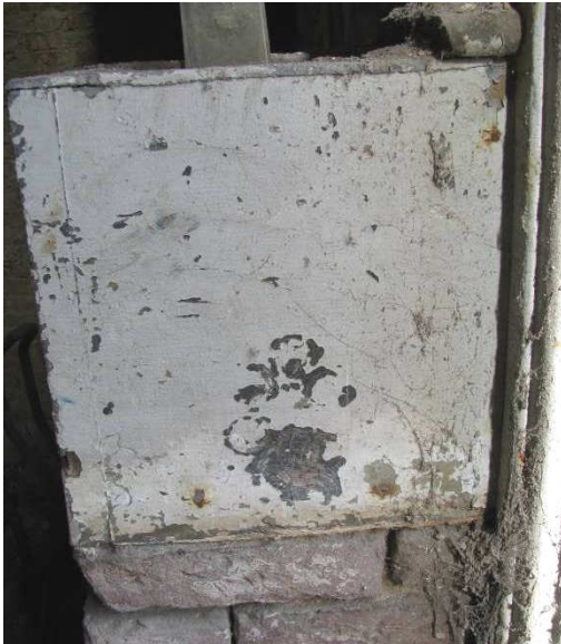
Afb. 17 –waterbak