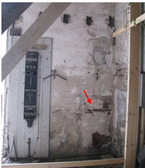
Afb. 15 – oranjerie oostgevel, dichtzetting

De achterkant van de oranjerie is ook aan de binnenkant nagenoeg identiek aan de voorkant, alleen heeft deze geen ingezette loopdeur en is hier geen laag poortje in de hoek van de gevel gemaakt. Tegen de deurstijlen zijn ter hoogte van het kalf twee driehoekige gietijzeren dragers bevestigd, op dezelfde hoogte zit aan de muur links en rechts in de hoek een houten drager. Hier kunnen ook etagèreplanken gezeten hebben voor kleinere planten en hangplanten (afb.18).