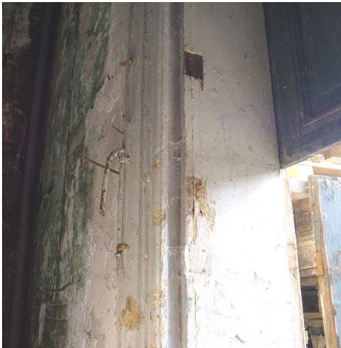
Afb. 6 – halfronde nekspinning van de (verdwenen) binnendeuren aan de oostzijde. Deze dienden voor extra isolatie in de winter.

De noordgevel is aan het zicht onttrokken door de aanbouw van het washuis.