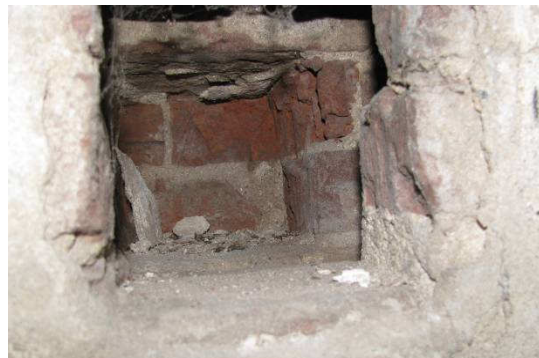
Afb. 20 – detail van afb. 19