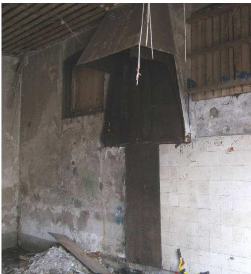
Afb. 24 – stookplaats washuis, rechter zijmuur

Het achtervertrek ligt enigszins verhoogd, en is via een doorgang met lichtgetoogde bovendorpel en een hardstenen drempel met twee treden te bereiken. Op de vloer liggen grote houten platen waaronder een houten vloer met brede delen, die bijna geheel verrot zijn (afb.26). Daaronder is een tegelvloer van betontegels met gaten aangetroffen. De wanden hebben een betegelde lambrisering, die deels verdwenen is. Daarboven stucwerk dat betegeld is geweest (afb.27). In de rechter wand is een groot laag raam, met binnenluiken. Aan de baksteen van de tussenmuur is te zien dat deze in een latere fase koud tegen de linker zijgevel is gezet, vermoedelijk had het washuis oorspronkelijk maar één groot vertrek (zie afb.25).