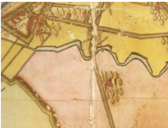
1611, Jansz & Schellincx. Het gebied ten zuiden van de stad Dordrecht is in 1603 officieel ingepolderd en in gebruik genomen. Het kronkelende riviertje is de Boerenkil. De kaarsrechte weg is de Krispijnseweg, toen nog Spuiweg.