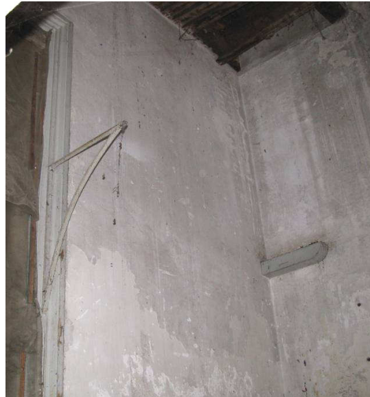
Afb. 18 – houten dragers