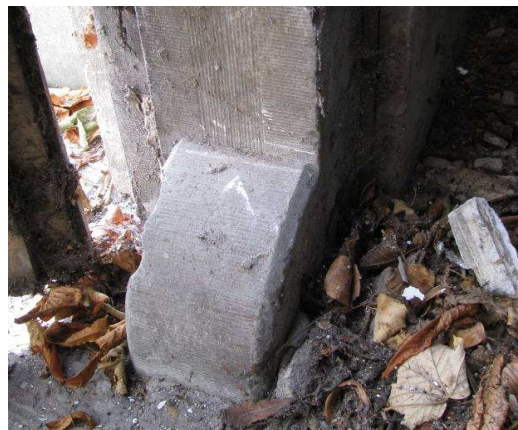
Afb. 11 – hardstenen gefrijnde neuten