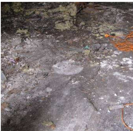
Afb. 21 – vloer van het washuis, met in het midden de afvoergoten en putje voor het vuile waswater