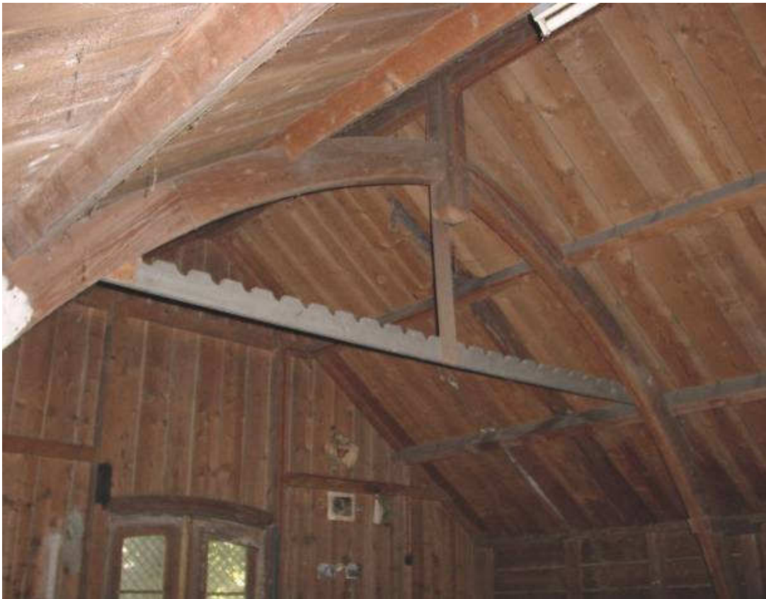
Afb. 14 – zolderverdieping washuis