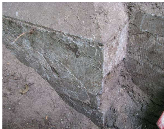
Afb. 5 – fundering van de oranjerie. Hoek westzijde.