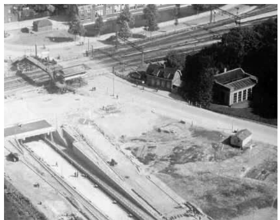
1937 – Krispijntunnel. Rechts in beeld de orangerie en een huisje in de oksel van het spoor en de toenmalige spoorwegovergang.