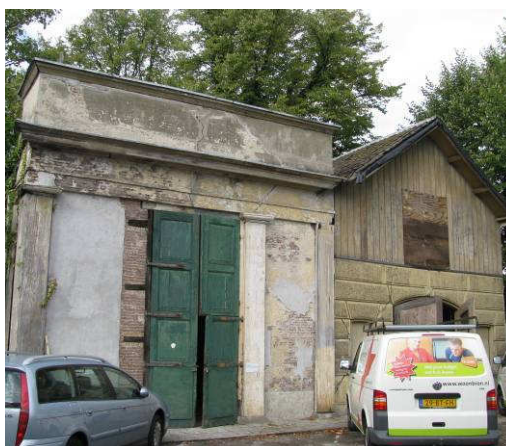
Afb. 2 – Oranjerie en washuis, oostzijde.

Tegen de noordwand (de rechter zijgevel) van dit gebouw staat het washuis, dat is gebouwd in chaletstijl. Het heeft een kleinere rechthoekige plattegrond van ca. 6 x 11 meter, die aan de achterkant iets terugspringt ten opzichte van de oranjerie, en bestaat uit twee bouwlagen waarvan één in de kap met zadeldak. De geprofileerde windveer met dito makelaar is verdwenen (afb.4).