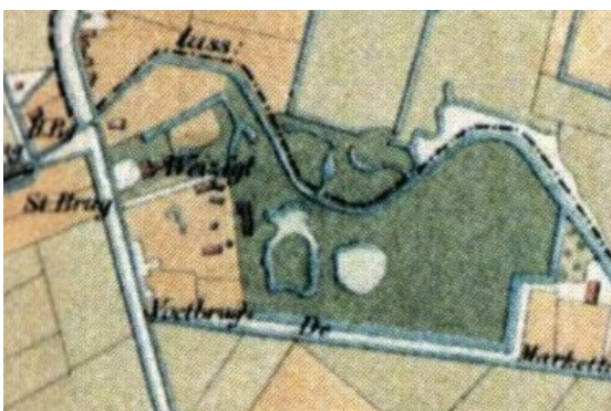
1858, Olivier & Machen