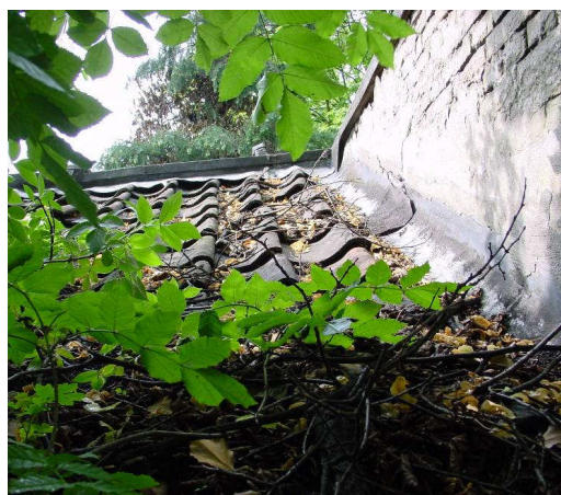
Afb. 3 – gesmoorde Hollandse pannen