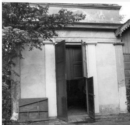
Afb. 7 – oude afbeelding van de RDMZ waarop de dubbele deuren nog aanwezig zijn