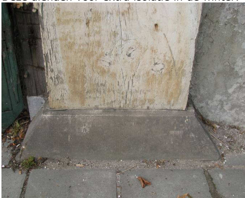
Afb. 8 – pilaster met hardstenen basement