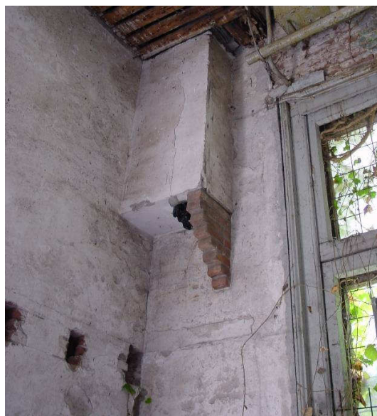
Afb. 16 – locatie van de etagère