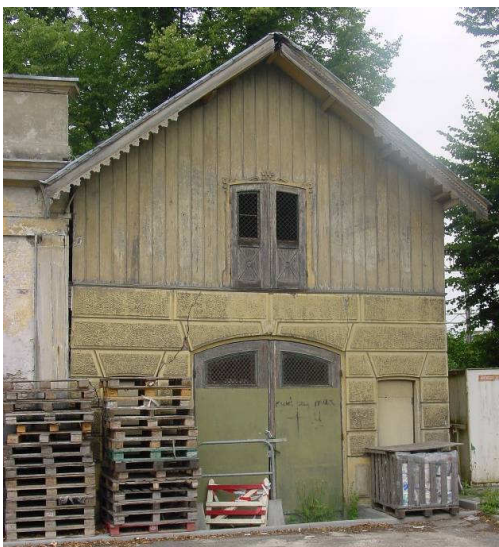
Afb. 4 – het washuisje

De voor- en achtergevels aan resp. oost- en westzijde zijn identiek. Ze hebben identieke dubbele toegangsdeuren waarbij het wel de vraag is of de deuren aan de achterkant zoveel gebruikt zullen zijn. Op de hoeken en aan weerszijden van de deuren zijn vier houten pilasters in Dorische stijl - aan de oostzijde zonder cannelures, aan de zuidzijde bijna allemaal met cannelures. Aan de oostgevel is de pilaster links van de toegangsdeur verwijderd, van de rechter hoekpilaster is het kapiteel weg. De dubbele houten deur reikt tot aan het hoofdgestel, in het rechter deel is een kleinere inzetdeur gemaakt. De beide deurvleugels hebben elk vier panelen met spiegel. Om de kou buiten en de warmte binnen te houden, had de oranjerie overal extra deuren aan de binnenzijde en op het dak een draadglas-constructie over de oorspronkelijke dakramen heen. Ook de oostgevel had als isolatie een extra deur aan de binnenzijde,