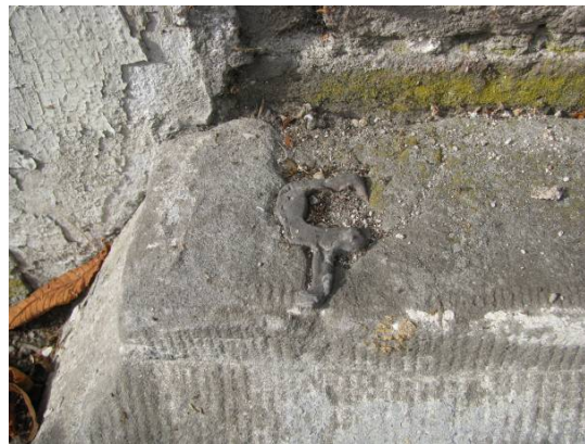
Afb. 9 – doken voor bevestiging van pilasters