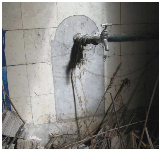
Afb. 22 – kraantje met marmere spatplaat