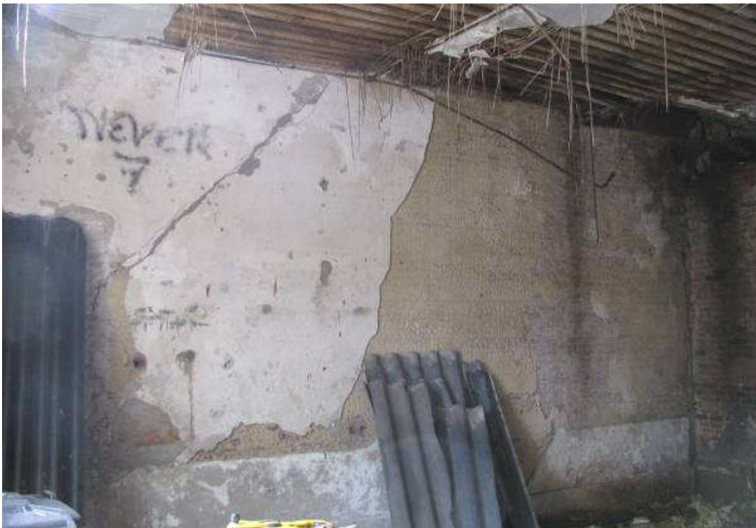
Afb. 23 – linker zijmuur van het washuis. Drie lagen stuc, rechtsboven is het oude trapgat nog zichtbaar.

Rondom hebben de muren een marmeren plint, met in de rechter zijmuur een kraantje waarachter een marmeren spatplaat die is aangevuld met gele tegeltjes (afb.22). Boven deze natuurstenen plint is nog een gestucte plint aangebracht (afb.23). De deur in de voorgevel heeft een hardstenen drempel en hardstenen gefrijnde neuten.