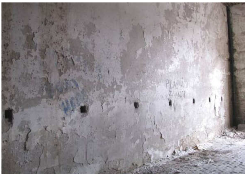
Afb. 19 – rij muuropeningen in de oranjerie