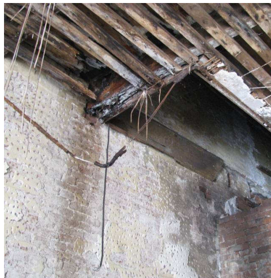
Afb. 25 – enkelvoudige balklaag, opgelegd in de zijmuur van de oranjerie