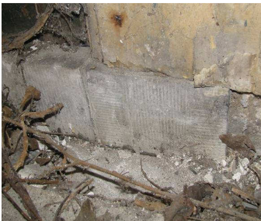
Afb. 10 –pilasters rusten op hardstenen neuten

Het washuis heeft een volledig houten kapconstructie met schenkelspanten, die opgebouwd zijn uit kwartcirkelvormige bogen van twee lagen schenkels. De spantbogen lopen langs een hoge borstwering naar beneden waar ze met blokkelen aan de muurplaat verbonden zijn. Een makelaar verbindt de nok aan de boogspanten. De makelaar is verbonden met een hanebalk waarop halve rondingen zijn uitgesneden: hierop werden ronde stokken gelegd om de was te drogen. Het houten dakbeschot rust op horizontale gordingen (afb.14).