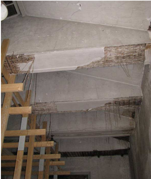
Afb. 12 – orangerie, kapconstructie met trekbalken die afgewerkt zijn met een pleisterlaag op houten latten en riet.