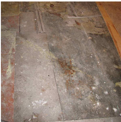
Afb. 26 – vloerdelen in de achterkamer washuis