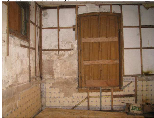
Afb. 27 – achterkamer washuis.