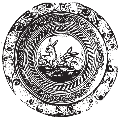
Afb. 2. Majolica schotel, Alkmaar, Luttk Oudorp 1560-'80.

Jan Baart ('Sixteenth century majolica from the North Netherlands' en 'The façon de Venice glass of Amsterdam') en Harold Henkes ('The influence of Antwerp in the development of glass production in the 16th and 17th centuries in the northern Netherlands') leverden hun bijdragen aan de lezingen vanuit ons land. Daarnaast verzorgden Sebastiaan Ostkamp, Rob Roedema en Rob van Wilgen een posterbijdrage met als titel 'The introduction of majolica in Alkmaar'. Het colloquium in Antwerpen en deze publicatie, vormen tezamen een waardevol vervolg op het colloquium dat in 1997 in Londen plaatsvond (D. Gaimster ed.,