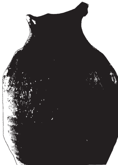
Afbeelding 2. Vooraanzicht van het schertskruikje.

Het kruikje (afb. 1 en 2) is gemaakt in Siegburg (Duitsland) en wordt op basis van vormgeving en decoratie gedateerd in de periode 1550-1575 of enige jaren later.