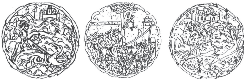
Afbeelding 3. Appliqué's. Schaal 1:2. Tek.: Joke Verschoor.

De andere mogelijkheid was, dat de drinker dacht een volle kruik te hebben, maar tot de conclusie kwam, dat het maar één slok was. In dat geval hebben we niet met een echte fopkan te maken, maar eerder met een (geoorde) schertsbeker. Schertsdrinkgerei is een verzamelnaam voor allerlei glazen, bekers, drinkkannetjes etcetera, waarmee men de sfeer op feesten en partijen wist te verhogen.