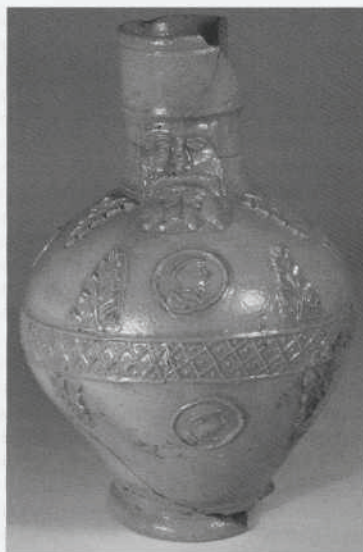
Afb. 18. Delft: Voorstraat 22. 16e-eeuwse baardmankruik, gevonden in een van de beerputten.