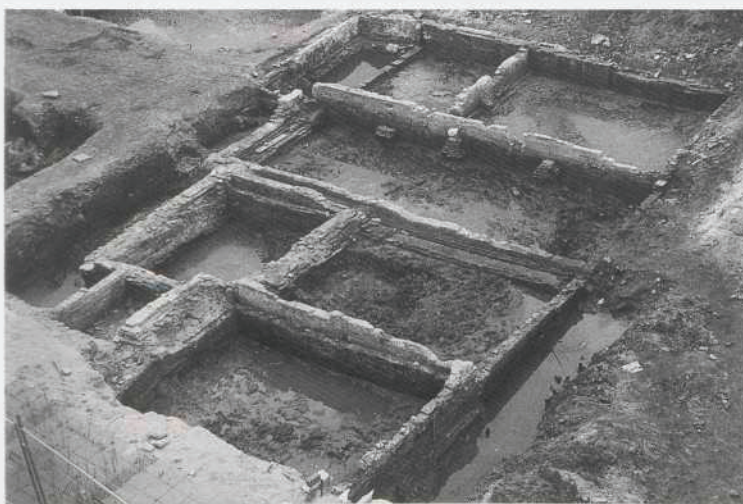
Afb. 19. Dordrecht: Statenplein. Overzichtsfoto van de opgegraven stadshuizen.