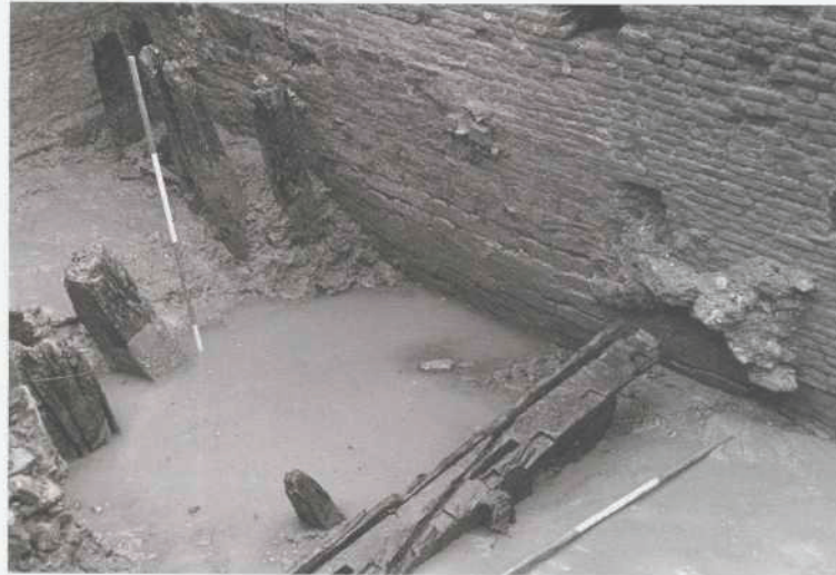
Afb. 17. Dordrecht: Wijnstraat. De 14e-eeuwse kademuur, opgetrokken uit Gobertangersteen, met daarvoor palen van havenwerken. De kademuur werd in de 17e eeuw opgehoogd en door middel van tussenmuren verbonden met een nieuwe kademuur (1617). Eén van de tussenmuren werd bebouwd op een secundair gebruikte moerbalk, die ook nog eens als gebintdeel dienst heeft gedaan.

verschillende vloerooppervlakken aangetroffen. In de voorlaatste fase deed de oudste kademuur nog dienst als scheidingswand, in de laatste fase was ook deze functie verdwenen.