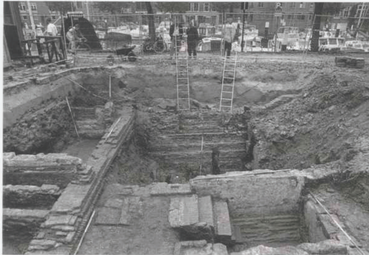
Afb. 16. Dordrecht; Wijnstraat. Op de voorgrond een 17e- en 18e-eeuwse kelder, gemetseld tegen de 17e-eeuwse opbouw van de 14e-eeuwse kademuur. Op de achtergrond een deel van de kade uit het begin van de 17e eeuw. Links fundamente van een 19e-eeuws woonhuis.

De opgravingsput werd aangelegd op het terrein van het voormalige pand Wijnstraat 10, met een kleine overlap naar Wijnstraat 8. In totaal was de werkput 10 x 10 m groot. Het terrein van het in september 1995 afgebroken pand Wijnstraat 12/14 werd benut voor de tijdelijke opslag van het stort en het plaatsen van de kraan.