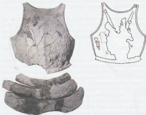
Afb. 14. Dordrecht: Dubbeldamseweg. Harnas bestaande uit een borststuk en drie buikstroken. De foto is kort na de berging genomen. De tekening is gemaakt na conservering. Grootste breedte (inclusief bolling) 51 cm. Foto en tekening C. van der Esch, Papendrecht.

een borststuk met 3 buikstroken, werd gedaan door K. Middelham met een metaaldetector op een diepte van -4,60 m NAP, dat is 4,80 m beneden maaiveld (Van der Esch 1995).