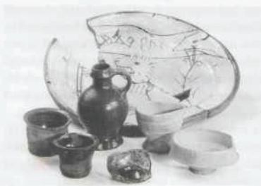
Afb. 12. Dordrecht: RKZ-terrein. Aardewerk daterend uit het einde van de 15e eeuw, gevonden in een beerput.

Plaatselijk is echter zeker dieper gegraven en is de ondergrond tot op grote diepte verstoord. Op korte afstand van de bestaande bebouwing aan de Grote Kerksbuurt konden funderingen van muren worden waargenomen, waarvan de onderzijden zich op ca 4 m onder het maaiveld bevinden. Gezien de baksteenformaten moeten deze panden uit de 13e of 14e eeuw stammen. Opvallend was dat op deze plaats 12e- en 13e-eeuwse Pafraath en kogelpot-