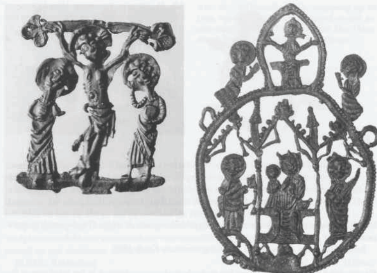
Afb. 14. Dordrecht: RKZ-terrein. Twee van de vele met de metaaldetector gevonden lood/tinnen religieuze (pelgrims-) insignes. Links: Calvarievoorstelling; Christus met links Maria Magdalena en rechts Johannes de Evangelist, hoogte 57 mm. Datering 13e eeuw. Rechts: rond pelgrimsinsigne met bovenin Christus tussen Maria en Johannes en onder Maria en kind tussen Petrus en Paulus, hoogte 105 mm. Herkomst mogelijk Aken, datering 14e eeuw.

Gouda: Patersteeg (afb.15) Door de Oudheidkundige Vereniging Golda werd een opgraving uitgevoerd aan de Patersteeg. Bij dit onderzoek zijn de tot nu toe oudste aanwijzingen voor bewoning binnen de stad Gouda aangetroffen. Het betreft een ophogingslaag op een diepte van meer dan 2 m onder het maaiveld waaruit aardewerk en enkele metaalvondsten werden geborgen, die teruggaan tot de 12e of het begin van de 13e eeuw (zie ook onder Nieuw-Lekkerland). Dat is geruime tijd voordat Gouda, in 1272, stadsrechten kreeg.