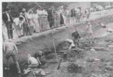
Afb. 21. Dordrecht: Dubbeldam. Opgraving van een kerkhof van vóór 1421.

is in de late 16e eeuw naar het oosten toe uitgebreid. Op de grens van de opgravingsput met het stadskantoor is een zijmuur van 6,2 m lengte aangesneden die waarschijnlijk de zuidmuur is van een gebouw dat buiten het onderzochte terrein valt.