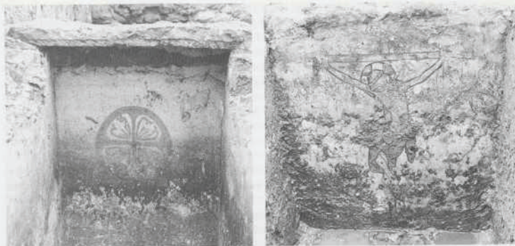
Afb. 10. Dordrecht: Voorstraat Links een van de jongere grafkelders (16e eeuw) uit de kerk van het Minderbroedersklooster. Op de korte wand is met oranje verf een kruis binnen een cirkel geschilderd. Een deel van de oorspronkelijke zandstenen dekplaat is nog aanwezig. Foto ROB. Rechts: Grafschildering van Christus aan het kruis. De foto is gemaakt kort na de ontdekking. De heldere kleuren en fijne tekening zijn goed bewaard gebleven, ook onder de plekken met aanslag van aarde en grondwater. De schildering bevond zich op de korte wand van een grafkelder in de zijbeuk van de kerk van het Minderbroedersklooster, bouwfase IIIA, en moet omstreeks 1375 zijn aangebracht. Foto ROB.