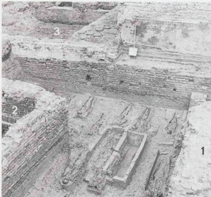
Afb. 9. Dordrecht: Voorstraat. De zuidoost hoek van de kloostergang van het Minderbroedersklooster, bouwfase III, in zijn vernieuwde en vergrootte vorm. Rechts de muur van het koor van de kerk (1), achter de muur links de kloosterhof (2), linksboven het inwendige van het nieuwe hoofdgebouw (3). De opgaande muur boven rechts is modern. Het opgravingsvlak ligt op de hoogte van één der jongere begraafniveaus. Begravingen in kisten en gemetselde keldertjes komen naast elkaar voor.

zetting. Nog niet eerder zijn zulke duidelijke resten uit een periode vóór de eerste vermelding van de stad aangetroffen. Het huidige stratenpatroon op deze plek gaat terug tot in de 12e eeuw, want het kan geen toeval zijn dat de 12e eeuwse voorgevel zich op de huidige rooilijn bevond.