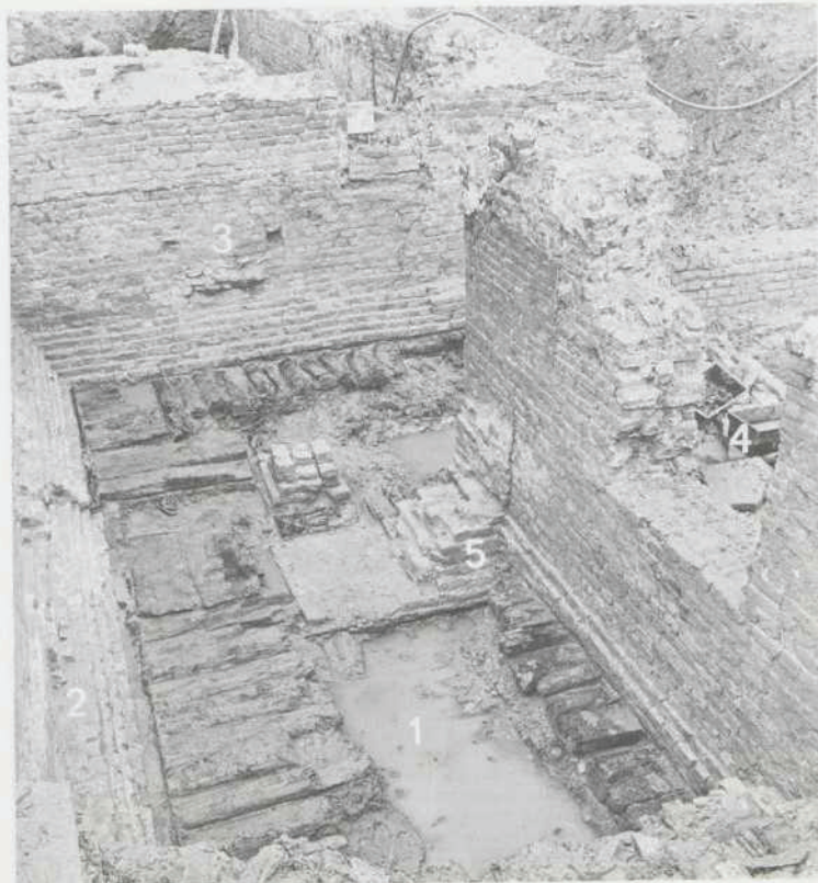
Afb. 8. Dordrecht: Voorstraat. Deel van kerk en kloostergang van het Minderbroedersklooster, bouwphase IIIA, uitgegraven tot op de houtfundering. Het betreft de noordwest hoek van de gang (1) tegen de muren van het koor (2) en zijbeuk (3) van de kerk. Achter de muur rechts de open ruimte van de kloosterhof (4). Onder de hoek van de kloosterhofmuur bevindt zich een restant van de kerk uit bouwphase II (5).

tussen de vier wanden en de lange gebruikperiode zullen aanpassingen en verbouwingen noodzakelijk hebben gemaakt. Dit verklaart wellicht de discrepantie tussen de C14-datering van het vlechtwerk van de westelijke wand, (GrN-12679, met 99% zekerheid tussen 1020 en 1210 A.D.) en de jaarringendatering van een wandpaal van de oostelijke wand (winter van het jaar 1206; determinatie drs. E. Jansma IPP, Amsterdam). Het aangetroffen aardewerk ondersteunt een datering van de bewoningsperiode in de tweede helft van de 12e eeuw en gedurende de eerste helft van de 13e eeuw. Tijdens de opgraving staaarden we naar de vroegste ontwikkeling van de Delftse neder-