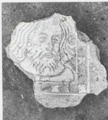
Afb. 11. Dordrecht: Minderbroedersklooster. Fragment van een vloertegel uit het Minderbroedersklooster. De versiering van het hoofd binnen een omlijsting is tot stand gekomen door opvulling van de in de roodbakkende ondergrond ingestempelde vlakken en lijnen met een lichtgeel bakkende klei.