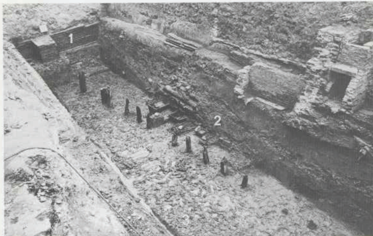
Afb. 12. Dordrecht: Voorstraat, Minderbroedersklooster, Fase I: de diepgelegen zuidoostelijke buitenmuur van de kerk (1) met aansluitend een rij palen van en kistbegraafingen in de kloostergang (2) langs de open ruimte van de kloosterhof (3). Alle andere muurwerk is jonger en behoort niet tot het klooster.