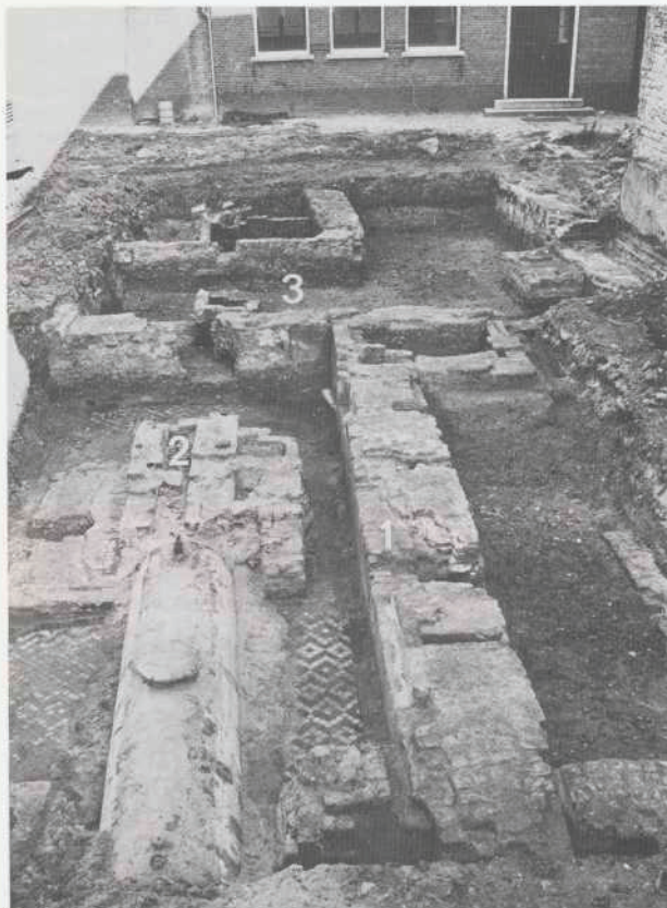
Abt. 14. Dordrecht: Voorstraat, Minderbroedersklooster, Fase III; een blik in noordoostelijke richting over het koor van kerk III met zijn rechte sluitingsmuren (1), betegelde vloer en altaarfundering (2); op de achtergrond kloostergang en -hof uit deze fase (3). De olietank op de voorgrond behoorde bij de afgebrande winkel.

Dordrecht: Ruigten bezuiden den Peereboom In de ten zuiden van de beneden Merwede gelegen polder Ruigten bezuiden den Peereboom werden door C. van der Esch onder een kleilaag muurwerk en bakstenen aangetroffen. Dit gebied maakte vroeger deel uit van de Biesbos. De vindplaats ligt in de in 1421 verloren gegane Grote Waard, zodat de vondsten ouder dan dat jaar moeten zijn. Mogelijk gaat het om de kerk of een ander gebouw van het verdwenen dorp Houweningen.