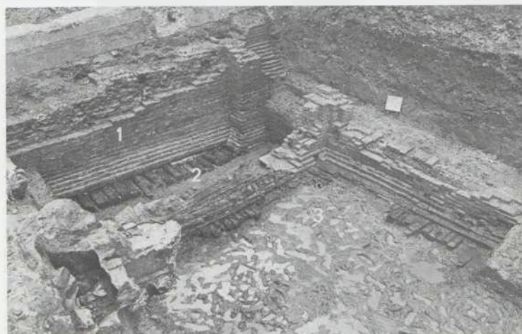
Afb. 13. Dordrecht: Voorstraat, Minderbroedersklooster, Fase II: onder recent muurwerk de zuidoostelijke muur van kerk II gefundeerd op kortelingen (1), waarlangs de kloostergang II (2). De bakstenen arcade van de kloostergang was gefundeerd op stukken scheepshuid en omzoomde de bijbehorende kloosterhof (3).