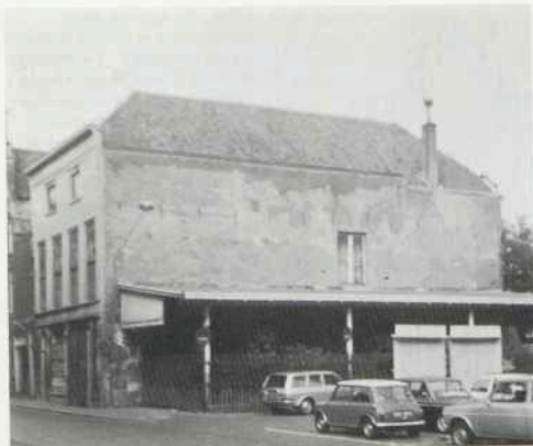
Afb. 1 Het weerganghuis vanuit het zuidwesten. (Opname 1975, door auteur.)

Een middeleeuws weerganghuis aan de Wijnstraat te Dordrecht