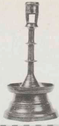
Afb. 31 Dordrecht. Bronzen kandelaar, c. 1500, uit beerput.