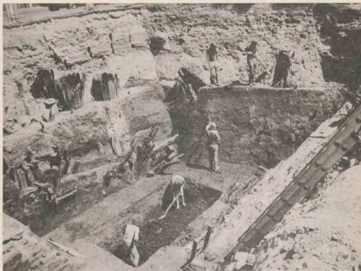
Afb. 29 Dordrecht. De opgravingsput aan de Torenstraat gezien naar het noordoosten. Onder baksteenfunderingen tonnen die als beerput

zijn gebruikt; daaronder hout ter versteviging van de ophoging. Op het diepste niveau de natuurlijke ondergrond van bosveen.