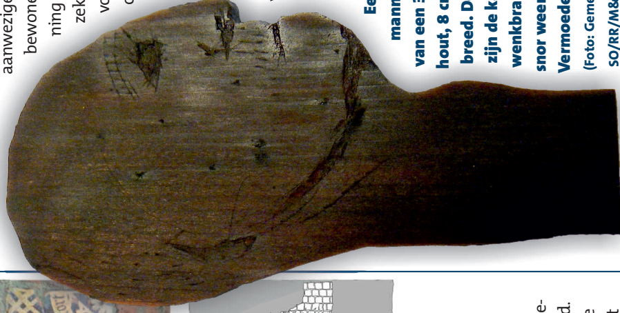
Een in profiel gesneden mannenhoofd, gemaakt van een 3 mm dik plaatje hout, 8 cm hoog en 4,5 cm breed. Door ingekerfde lijnen zijn de kaaklijn, oor, oog, wenkbrauw, neus, mond en snor weergegeven. Vermoedelijk 19de-eeuws.

aanwezige kostkinderen of de bewoners van de rectorswoning is niet met zekerheid te zeggen. Alle vondsten zijn gevonden op de plek waar de vermoedelijke afvoergoot uit de rectorswoning in de beerkelder uitkomt. De beerkelder werd voor het laatst gebruikt in de 20ste eeuw.