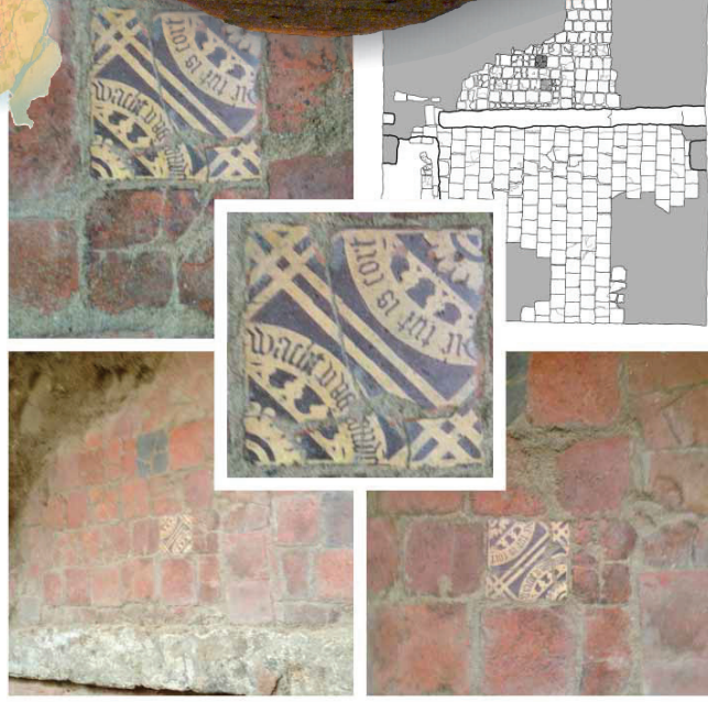
De 16de-eeuwse spreuktegel in de 17de-eeuwse plavuizenvloer van de Latijnse School en in detail.

Waarschijnlijk heeft de spreuktegel oorspronkelijk deel uitgemaakt van een vloer in het klooster en is, als moraliserende zinspreuk voor de leerlingen, hergebruikt in de vloer van de Latijnse School. Pas vanaf het eerste kwart van de 19de eeuw vinden er grootschalige veranderingen plaats. In 1823 wordt het noordelijke leslokaal aan de achterzijde uitgebreid.