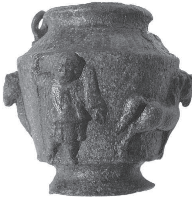
Afb. 42. Den Haag * Uithofslaan. Bronzen zalf- of wierookvat uit de Romeinse Tijd.

Behalve bewoningssporen uit de Romeinse Tijd zijn ook laatmiddeleeuwse sporen onderzocht die in verband kunnen worden gebracht met activiteiten op en rondom de Uithofboerderij waarvan de 13de-eeuwse fundamenten in 2005 op vindplaats 1 zijn gelokaliseerd en onderzocht (Pavlović 2006). Een van de meest opvallende sporen betreft een deels intacte bakstenen vloer van circa 7x7 m, vervaardigd van (hergebruikte?) kloostermoppen van het formaat 31x14x8 cm (afb. 43). Er zijn geen sporen gevonden die wijzen in de richting van een overkapping. De vloerconstructie zelf is opmerkelijk; de vloer loopt namelijk richting noordwesten flink af. De functie blijft vooralsnog onduidelijk, maar gedacht kan worden aan activiteiten rondom het aan- en afvoeren van (landbouw)goederen.