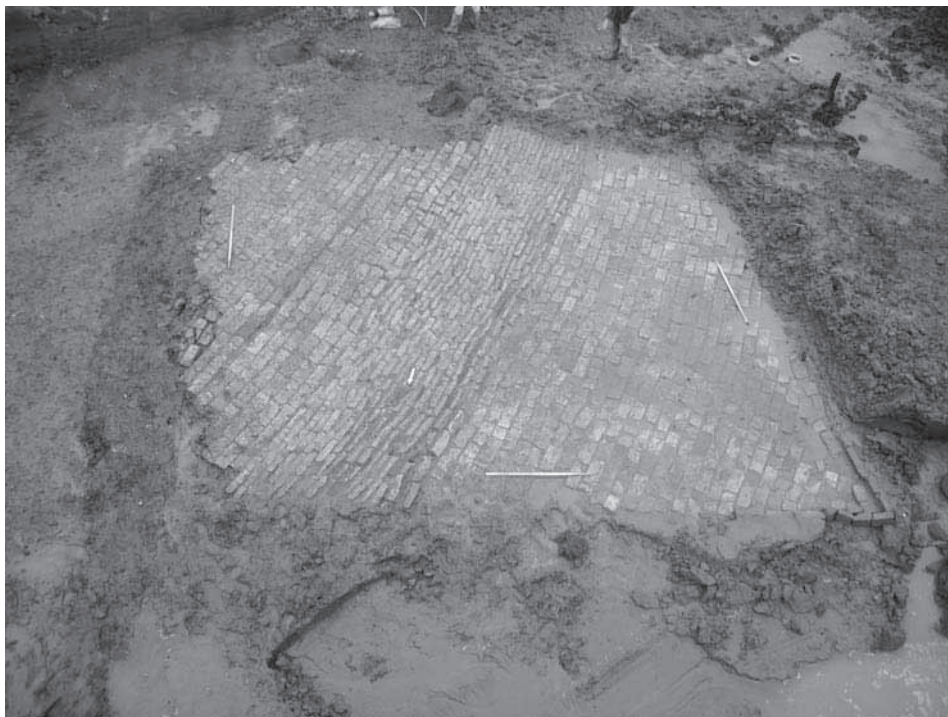
Afb. 43. Den Haag * Uithofslaan. Vloerconstructie van kloostermoppen op het erf van de Uithofboerderij.

het maaiveld) middeleeuwse muurresten gevonden van een kerktoren, een grafveld met menselijke resten, waterlopen (vermoedelijk een zijarm van de Dubbel) met vlechtwerkbeschoeiingen, afvaldumpplaatsen, een fuik en twee uitgeholde boomstamduikers.