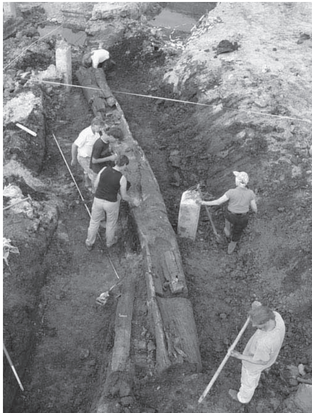
Afb. 45. Dordrecht * Amnesty Internationalweg. Houten duiker in situ.