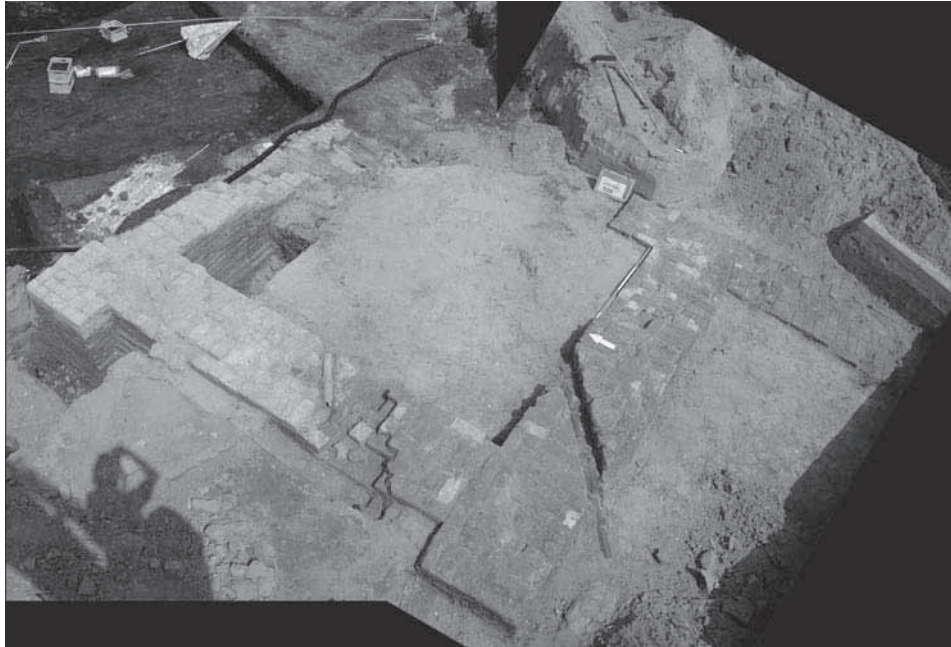
Afb. 44. Dordrecht * Amnesty Internationalweg. Het fundament van een kerktoeren.