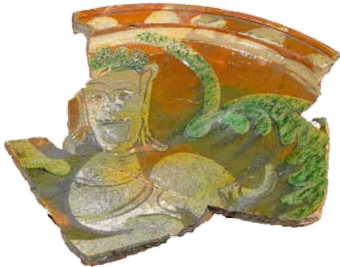
[4] Een schenktuit van keramiek in de vorm van een draak en een bordfragment met een versiering van mogelijk een koning met het lijf van een fabeldier. Luxe aardewerk uit Vlaanderen.