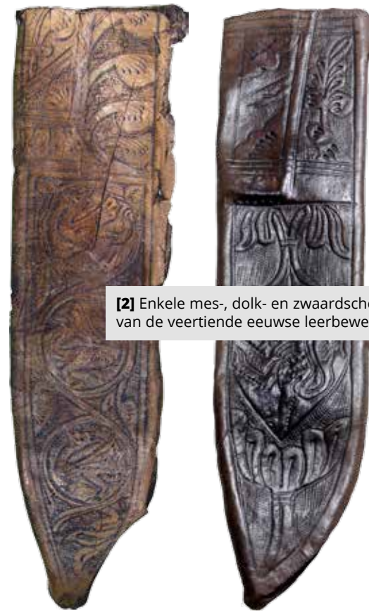
[2] Enkele mes-, dolk- en zwaardschedes van de veertiende eeuwse leerbewerker.

De middeleeuwse bewoners sierden zich graag met verschillende sieraden. Doordat er vanaf de veertiende eeuw