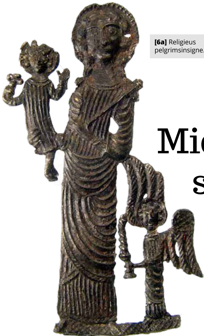
[6a] Religieus pelgrimsinsigne.