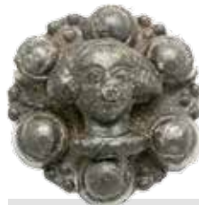
[6b] Enkele religieuze pelgrimsinsignes.