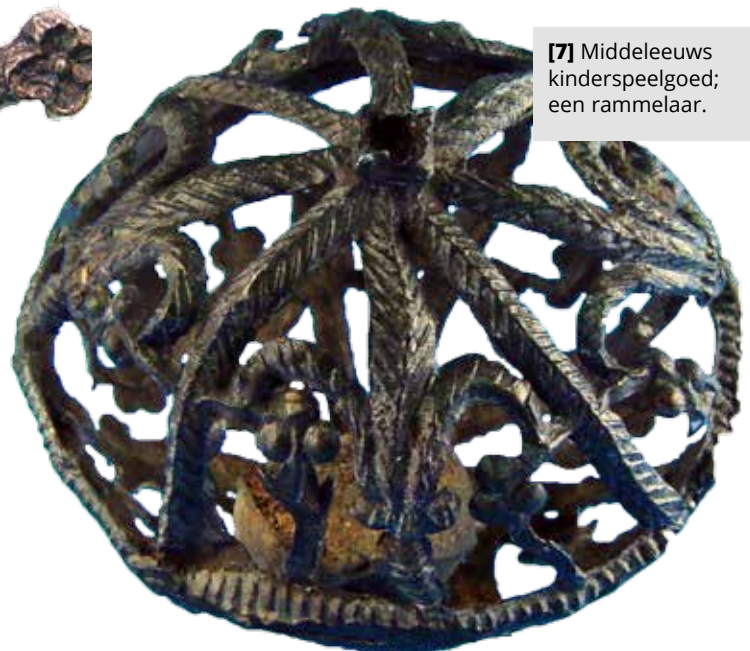
[7] Middeleeuws kinderspeelgoed; een rammelaar.