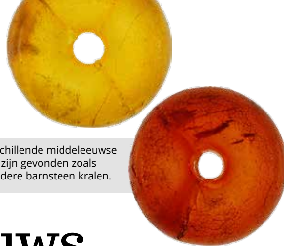
[5a] Verschillende middeleeuwse sieraden zijn gevonden zoals onder andere barnsteen kralen.