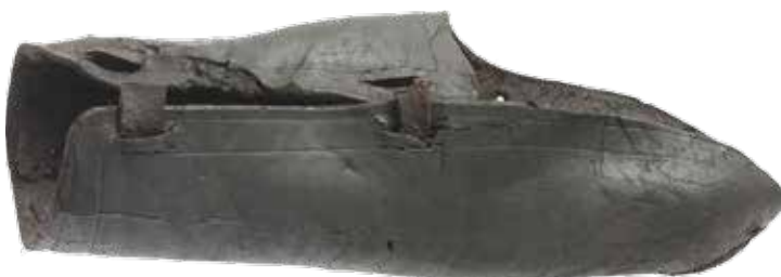
[3] Een leren onderarmbeschermer en een (mogelijk) schildfoedraal met een versiering van (fabel)dieren.

Een speciaal soort broches dat erg populair was in de 14e eeuw zijn de lood-tin insignes. Ook deze werden op de kleding of hoofddeksels gedragen. Op de meeste insignes is een religieuze voorstelling afgebeeld en deze worden ook wel pelgrimsinsignes genoemd. (afb.6a/b) Hierop staan Bijbelse taferelen en figuren, heiligen en bisschoppen en voorstellingen van verschillende mirakels