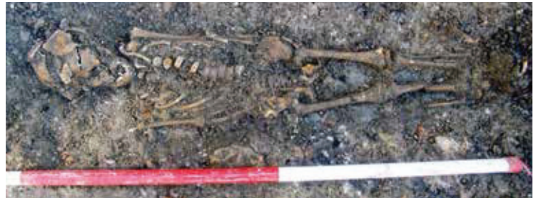
De fundering van de put (l.o.) en de gevonden skeletten

kloosterkerk - nu Augustijnenkerk - ter kerke gingen. Begraven worden bij de monniken was heel gewild, omdat het klooster werd gezien als de veiligste plek voor eeuwige zielenrust. <