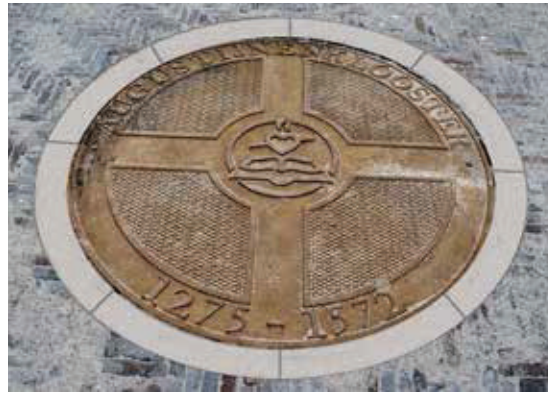
Op de plaats van de waterput ligt een deksel met het logo van de Augustijner Orde

Hoewel bij een klooster natuurlijk wordt gedacht aan monniken, was dat bij deze begravingen duidelijk niet aan de orde. Het gaat hier om (gegoede) burgers die waarschijnlijk in de