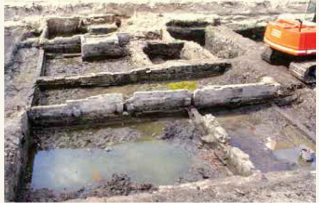
De muren van vier bakstenen huizen die vanaf de 15de eeuw aan de Kromme Elleboog (links) stonden.

Vanaf ongeveer het begin van de 15de eeuw waren alle percelen aan beide straten bebouwd met bakstenen huizen. Omstreeks deze tijd werd ook de Kromme Elleboog verhard met veldkeien. De huizen stonden dicht naast elkaar en hadden alleen aan de achterzijde een open erf tot aan het grachtje. De haarden werden verplaatst naar één van de zijmuren in het voorhuis, of naar de muur tussen het voor- en achterhuis.