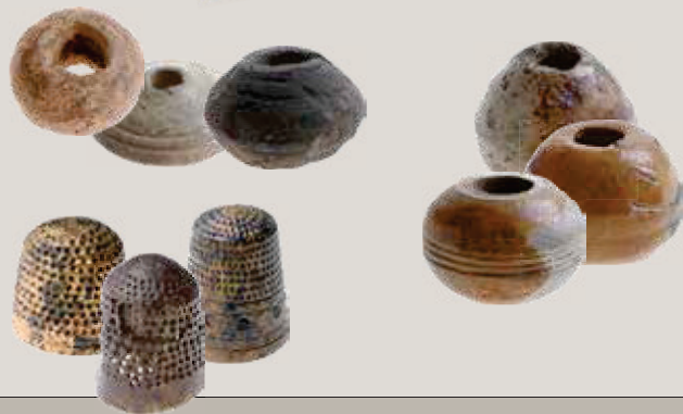
NAAI-, WEEF- EN SPINGEREI