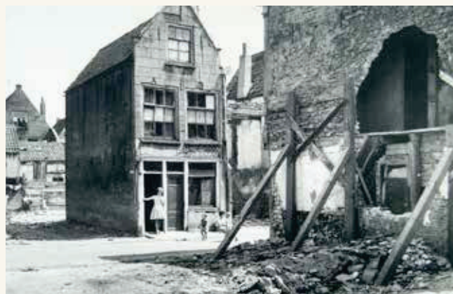
De verkrotte Kromme Elleboog in 1960

Vanaf de 17de eeuw ging de welvaart van de wijk achteruit en was er sprake van verval. Dit zette zich door gedurende de 18de en 19de eeuw en dat is ook te zien aan het archeologisch materiaal: er zijn vrijwel geen bijzondere en luxe voorwerpen uit deze perioden gevonden. Vanaf de 19de eeuw was er sprake van een krottenwijk. De huizen werden door meerdere grote en voornamelijk arme families bewoond, zo blijkt uit de sporen die zij nalieten. Door de overbevolking en onhygiënische leefomstandigheden braken er regelmatig cholera-epidemieën uit. Eén van de oorzaken was het sterk vervuilde binnengrachtstelsel. In 1854 werd het grachtje