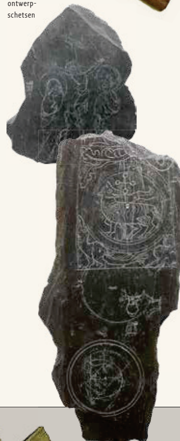
Leistenen met ontwerp-schetsen