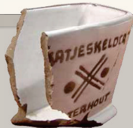
Snoepbakje van bungalowpark Katjeskelder