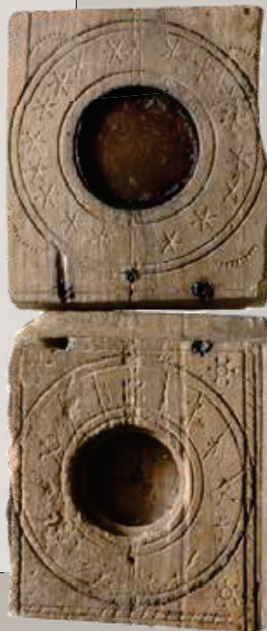
Zakzonnwijzer van hout