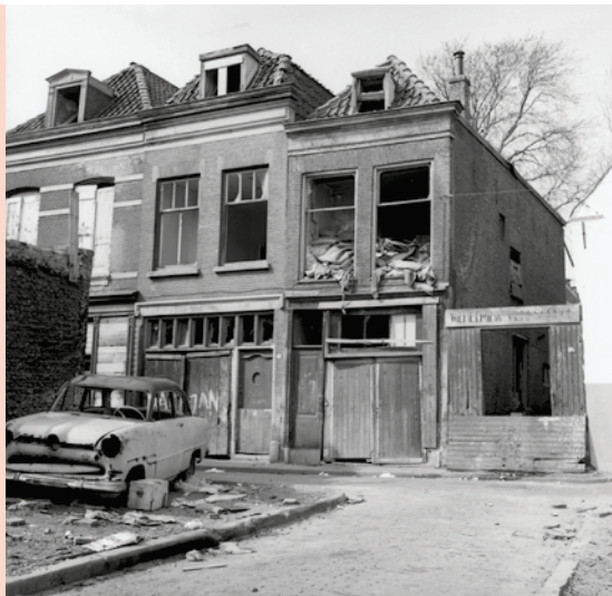
In 1960 zag de Augustijnenkamp er zo uit