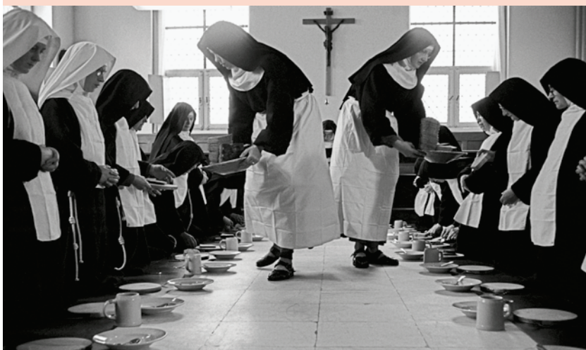
Clarissen in Megen tijdens de maaltijd op Goede Vrijdag Foto: Guus Bekooy, Megen 1961, collectie Museum voor Religieuze Kunst, Uden.

“...zwarte wielen, linnen (hoofd)doeken en grauwe rokken, dragende achter en voor scapulieren, omgord met geknoopte zeelkoorden ten voeten ahangende.” Een wiel was een nonnensluier die het gezicht bedekte en tot de voeten reikte. Scapulieren zijn korte capes.