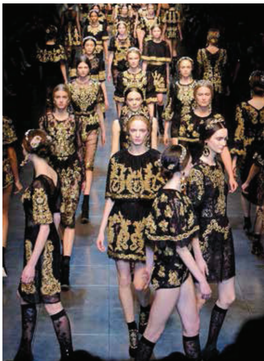
Renaissance Collection 2012 van Dolce & Gabbana