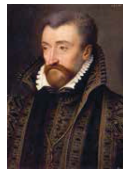
ANONIEM Antoine de Bourbon, 1557