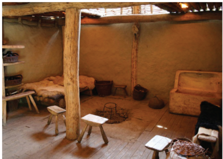
IJzertijd-interieur. (Historisch Openluchtmuseum Eindhoven)

aanwezig, waarschijnlijk verfstof. Dergelijke versieringen worden vaker op IJzertijdaardewerk aangetroffen. Op basis van de vorm van de pot en de manier van versieren is de pot te dateren in de vroegste fase van de IJzertijd: tussen circa 800 en 500 voor Christus.