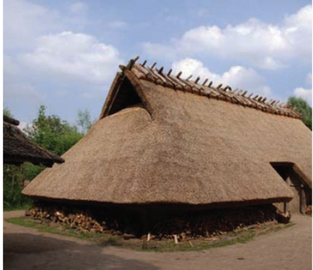
Reconstructie van een IJzertijd-boerderij. (Historisch Openluchtmuseum Eindhoven) Mogelijk hebben op Dordts grondgebied langs het riviertje de Dubbel ook min of meer vergelijkbare boerderijen gestaan.

Twee scherven waren erg klein en hiervan kan dan ook niet veel gezegd worden. Een derde scherf was groot genoeg om meer details te bekijken en een goede reconstructie van de complete pot te maken. De bodem is helaas niet gevonden en dus is de hoogte van de pot onbekend. Het gaat in ieder geval om een handgemaakte pot met een diameter van 23 cm. De rand is aan de bovenkant versierd met schuine indrukken die zijn gemaakt met een stokje. De buik van de pot is, wat archeologen noemen 'besmeten': voordat de pot werd gebakken, smeet de pottenbakker een kleipapje tegen de buitenwand van de buik. Na het bakken vormde dit een ruwe laag, zodat handen meer grip op de pot hadden en deze niet zo snel kon vallen. Op de buitenkant van de pot is een donkere streep