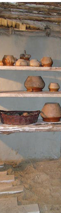
Keramiek in een IJzertijd-woning. Historisch Openluchtmuseum Eindhoven

Dat er op de oever van het riviertje de Dubbel Romeinen verbleven in de 1ste en 2de eeuw na Christus is duidelijk: ze lieten er ondermeer bouwpuin, gereedschap, keramiek, een mantelspeld en enkele munten achter'. Maar woonden er vóór de Romeinen ook al mensen op Dordts grondgebied? Die vraag konden we lang niet beantwoorden, maar sinds het archeologische onderzoek op het Gezondheidspark in augustus 2010 wel.