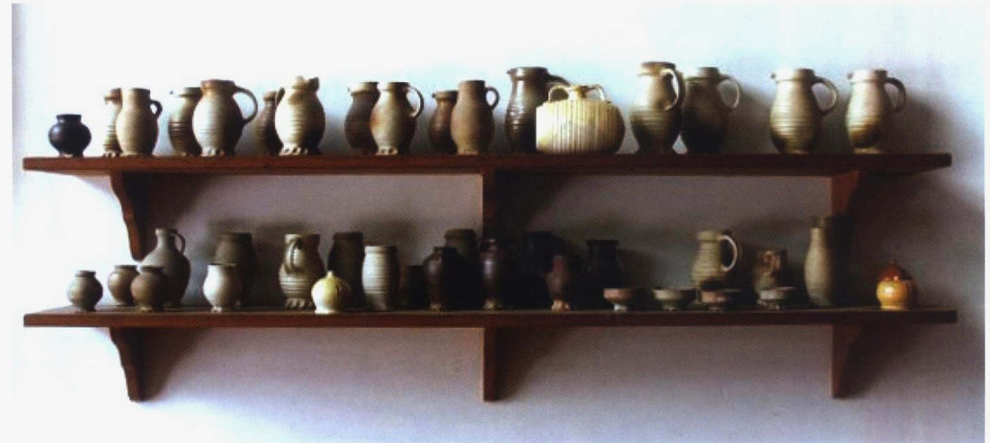
Boven: Steengoed drink- en schenkkannen in een middeleeuws huis in Archeon in Alphen aan den Rijn.

Blijkbaar waren de Duitse steengoedkannen erg gewild, want de Dordtse pottenbakkers maakten deze drinkkannen dus direct na uit lokaal gewonnen klei. De lokale imitaties waren echter niet van dezelfde kwaliteit als het Rijnlandse steengoed. Ze waren dikker, grover van vorm, minder goed afgewerkt en niet van steengoed, maar van zachter gebakken aardewerk. Hoewel de Rijnlandse steengoedkannen in grote hoeveelheden werden aangevoerd, kon mogelijk niet iedereen in de middeleeuwse samenleving zich deze