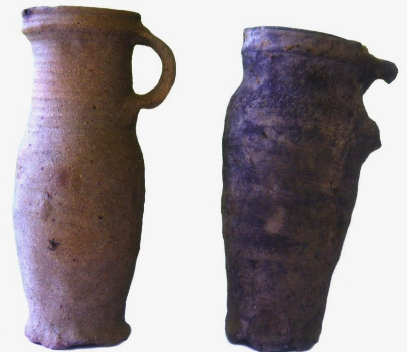
Rechts: Een vergelijking van drinkkannen uit de middeleeuwse stad Dordrecht. Links een Rijnlandse bijna-steengoed kan uit de periode 1200-1280, afkomstig van de opgraving Woerdenbach aan de Kolfstraat (2000). Rechts een lokale imitatie van grijsbakkend aardewerk, afkomstig van de opgraving op de Elfhuizen (2005).