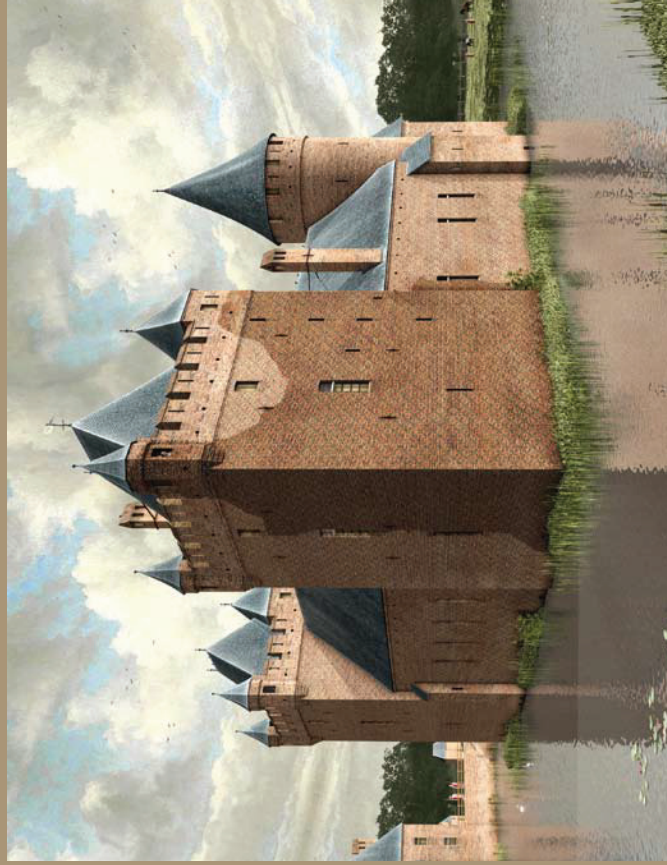
Zo zag het huize Huis te Merwede er mogelijk uit (Reconstrctie: P. Bos/Zodi Design)