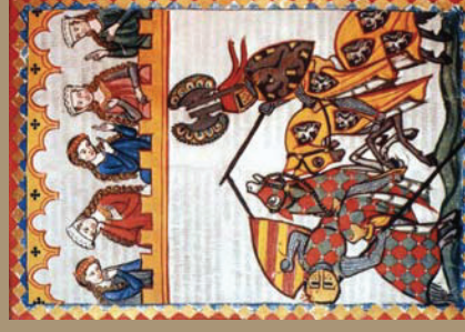
Ridders (Miniatuur uit de Code Manesse, 1305-1310)

Die ruïne aan de Merwede is het oudste stenen gebouw van Dordrecht. De