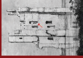
Uitsnede uit bekering van Redant (Roghman, 1647)