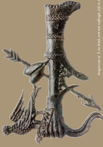
Imagie van ca. 8 cm breed, arm met roofgloed, pijl en doerboord haer (Collectie: Erfgoedmuseum DIERP)