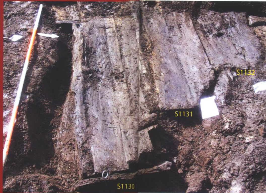
Het collectieve graf.

Hij verkent het terrein met zijn ogen, rent een stuk, verschuilt zich en rent weer verder. Het moet al tegen de vespers zijn. Eindelijk ziet hij de Dubbel. Gelukkig kan hij zwemmen, want zijn dorp ligt aan de andere kant van het water. De Dubbel stroomt traag en de bedding is niet erg diep. De vele oeverplanten en het hoge riet zullen hem dekking geven. Hij richt zich een laatste keer op om te