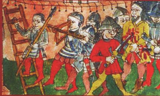
Uitsnede uit een miniatuur in Speculum humanae salvationis en andere teksten, Keulen, frater Nicolaus (kopiist), ca. 1450.

Schichtig kijkt de man achterom. Zijn ze hem gevolgd? Hij probeert stil te zijn maar kan nauwelijks voorkomen dat zijn gehijg in de stille avond klinkt als het op en neer bewegen van de blaasbalg van de smid... Hoeveel mijlen heeft hij al gerend...?