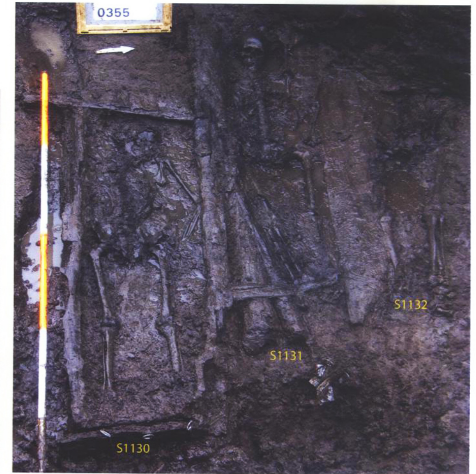
De skeletten van de door geweld omgekomen mannen.