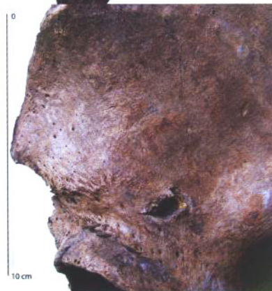
Het bekken waarop de in- en doorslag van een scherp gepunt voorwerp te zien is. Dit kan een pijlpunt zijn geweest naar voorbeeld van de (op de foto ingezette) 14de eeuwse kruisboogpijlpunt die in 1997 is opgegraven op het Statenplein.