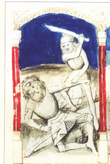
Miniatuur in Petrus Comestor, Historia scholastica (fragment). Biblia pauperum, ca. 1450-1455.

waarschijnlijk is veroorzaakt door een puntig steekwapen of een pijlpunt. Het gat aan de achterzijde van het bekken is hoekig van vorm en meet 1x0,8 cm. Aan de voorzijde is hierdoor een opstaande botsplinter ontstaan. De steek of het schot is dus van achteren toegebracht en heeft het bot doorboord. Daarnaast vertoont de linker achterzijde van de schedel een slagspoor met een lengte van 3,5 cm. Een dergelijke verwonding zal veroorzaakt zijn door een zwaard of bijl en is eveneens van achteren toegebracht. Ging het hier om een vluchtende persoon? Zwierven er in zijn tijd roven-de en brandschattende bendes rond en verdedigde hij zijn dorp? Had het te maken met de Hoekse en Kabeljauwse twisten? We weten het niet, maar in elk geval zijn beide verwondingen zeer ernstig geweest en aangezien genezing van het bot niet heeft plaatsgevonden, kunnen we aannemen dat de man aan deze verwondingen is overleden.