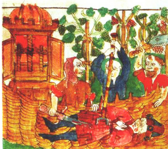
Uitsnede uit een miniatuur in Speculum humanae salvationis en andere teksten, Keulen, frater Nycolaus (kopiist), ca. 1450.

Meer weten over de opgravingen van 2009? Begin 2011 zal het volledige onderzoeksrapport te vinden zijn op www.dordrecht.nl/archeologie .