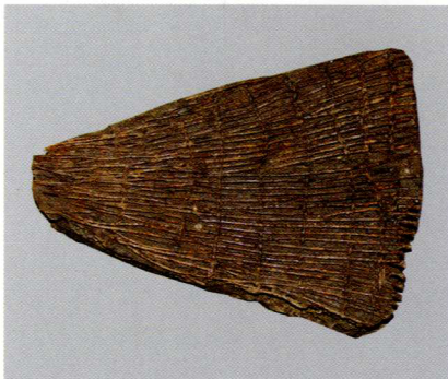
De 'fuik' die in 2006 is opgegraven op het Gezondheidspark

In DiEP Magazine 5 werd in de rubriek 'Uit de collectie van' een archeologische vondst beschreven die in 2006 is gevonden op het Gezondheidspark (Combibadterrein). Het ging om een voorwerp dat erg leek op een visfuik, maar eigenlijk