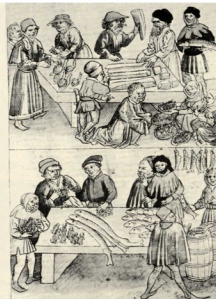
Das Konzil zu Konstanz, 1414-1418; verkoop van gepelde en verse vis, kikkers en slakken. Ulrich Richental, Ratzenmusem, Konstanz

Archeologische vondsten kunnen niet altijd even gemakkelijk uit de grond worden opgepakt. Ook zijn ze niet altijd even eenvoudig te determineren. Dit gold ondermeer voor de fuik. Een dergelijk kwetsbaar voorwerp van organisch materiaal gewoon oprapen, leidt tot een zakje vol versnipperde takjes... Daarom is het voorwerp in z'n geheel gelicht met behulp van een dikke plaat, waarna het is gevriesdood. Maar verschillende vragen bleven over: van welk materiaal is de fuik gemaakt? En welke vissoorten konden ermee worden gevangen? De vraag over het gebruikte materiaal is inmiddels beantwoord door onderzoeksbureau BIAx in Zaandam, waar de fuik momenteel verblijft. De fuik blijkt te zijn gemaakt van eenjarige wilgentwijgen, die in de winter zijn gesneden.