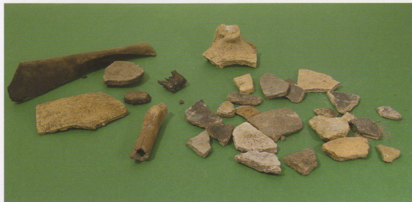
Aardewerk en dierlijk bot bij de vijvers langs de Overkampweg

Afgelopen half jaar zijn er twee inventariserende archeologische onderzoeken uitgevoerd in wat eens het stroomgebied van de Dubbel was. Het eerste onderzoek vond plaats in de wijk Krispijn, naar aanleiding van een eerder uitgevoerd booronderzoek. Hier werd een archeologische proefsleuf aangelegd. In deze sleuf werden enkele sloten gevonden die tijdens de Sint Elisabethsvloed zijn gevuld. Daarnaast werd voor het eerst in lange tijd nog een teken van menselijke aanwezigheid gevonden: aardewerk. Het aardewerk, dat kon worden gedateerd in de periode 1000-1300 en de andere sporen zijn indicaties dat zich in de directe omgeving resten van bewoning bevinden. Uit het onderzoek bleek ook dat het niet nodig was om op deze plaats verder (uitgebreid) onderzoek te doen. De geplande nieuwbouw zal, zelfs als deze direct boven de huisplaats wordt gerealiseerd, de archeologische resten nauwelijks schaden. Later dit jaar wordt op een andere, nabij