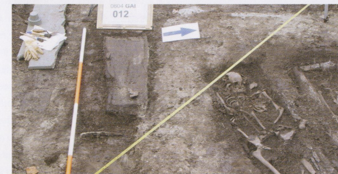
Kindergrafje en graven van twee volwassen vrouwen