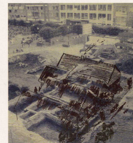
Middeleeuwse huisplattegronden, opgegraven op het Statenplein (1997). Over de plattegronden heen zijn houten huizen getekend, zoals het ooit misschien was aan de Kromme Elleboog.