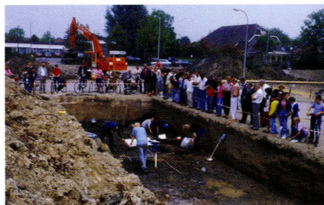
Opgravingen op het MOK-veld in de jaren '80 van de twintigste eeuw (Foto AWN-Lek en Merwestreek).