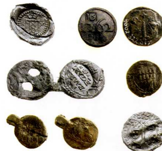
Van links naar rechts en van boven naar onder: Textiellood met gekroond wapenschild van Amsterdam + HM (keerzijde blanco). Bakenlood met op de voorzijde het jaartal 1762 en een klok met 1 en 15. Keerzijde: wapen van Haarlem. Verflood met de tekst: LEYDE VERWE (in een klok over het Leidse wapen heen). Textiellood, mogelijk afkomstig uit Dordrecht. Fragment met tekst + toltoren van Dordrecht? Verflood met tekst: 'Dordrecht'. Keerzijde adelaar. Textiellood, mogelijk uit Den Bosch. Wapenschild, boom en letters 'GHERITS' + huismerk 'GW'. Navraag bij de archeologische dienst van Den Bosch gaf echter geen uitsluitsel.

De collectie DiEP/Archeologie bestaat uit ruim 120 loodjes die in Dordrecht zijn opgegraven. Het gaat voornamelijk om loodjes uit de 16e/17e/18e eeuw. Van slechts 29 loodjes is de (mogelijke) herkomst te achterhalen. De buitenlandse loodjes komen uit Bremen, Stendal, Statt neu Rupin en Leipzig (Duitsland), Norwich (?), Colchester en Devon (Engeland) en een enkel exemplaar mogelijk uit (noord) Frankrijk. Op het lood van Colchester staat 'DWS COLCHEST BAY'. Baaïen en saaien zijn wollen stoffen die daar werden vervaardigd door gevluchte Vlaamse drapeniers (1565 en 1570). Op een lood uit Bremen is te lezen 'BOMASIN', met op de voorzijde het wapen van Bremen. Op dit loodje wordt de stofsoort aangegeven: bombazijn. Ongeveer de helft van deze 29 exemplaren komt uit Nederland: Amsterdam, Haarlem (een bakenlood), Leiden (een verflood en enkele lakenloden), Rotterdam, Delft, Gouda (?), Dordrecht (2x onzeker, 1x zeker een verflood), Den Bosch (?), Amersfoort (bombazijnindustrie) en Kampen.