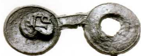
Van boven naar beneden: Textiellood met huismerk met de letters CD en X. Textiellood met huismerk met de tekst: AGAERS. Textiellood met huismerk met de letters IVR, keerzijde krastelmerk. Textiellood met huismerk, keerzijde krastelmerk. Leeuw met vaandel en jaartal (1)691. Keerzijde met huismerk en de letters IS.