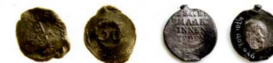
Textiellood met Leidse sleutels en de tekst 'LEYDS GOET'. Keerzijde met klok '36' (de stoflengte op de rol). Textiellood met tekst: '(WOLLE D)EEKEN GEMAAKT BINNEN LEYDEN'.

De Leidse lakenloodjes zijn vaak wel goed te herkennen. Hierop staat dan bijvoorbeeld: 'WOLLEN DEEKEN GEMAAKT BINNEN LEYDEN', of 'LEYDS GOET'.