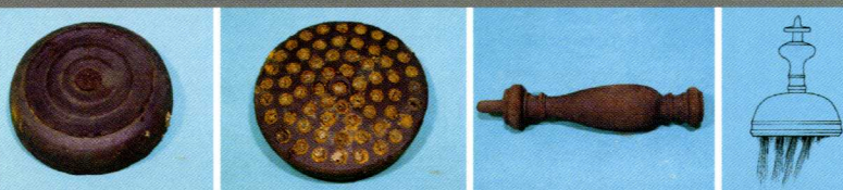
Handvegerijje (Varkenmarkt 2003)