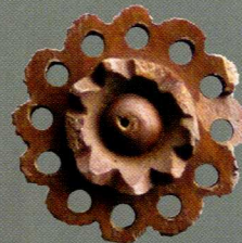
Benen knoopje (Statenplein 1997)

De beerput van de Grote Markt bevatte vooral resten van 14e/15e eeuwse schoenen en vooral 14e-eeuwse keramiek, waaronder kook- en drinkgerei. Onder de dierlijke resten bevonden zich de gebruikelijke soorten als rund, varken, schaap/geit en divers gevogelte als eend (meerdere soorten), kip en gans. Maar ook een botje van een kievit en enkele resten van zwaan en grote zaagbek. De gebruikers van de beerput bleken tevens haas en/of konijn te hebben gegeten. Daarnaast veel vis, zoals haring, platvis, vleet, paling, brasem, karper, spiering, wijting, schelvis, pos, baars, schol en bot. Verder zijn in de beerput graanresten gevonden van boekweit, haver, rogge, broodtarwe, emmertarwe en spelttarwe. Ook is zwarte mosterd gevonden en de gebruiksplanten gageel, hennep, maanzaad, roos, jeneverbes en wouw. Noten, fruit en groente werden eveneens aangetroffen in de monsters: hazelnoot, walnoot, vijg, druif, zoete- en/of zure kers, appel, peer, biet en venkel. De sluitdatum van de beerput ligt waarschijnlijk aan het begin van de vijftiende eeuw. De status van het/de huishouden(s) lijkt niet al te hoog te zijn geweest.