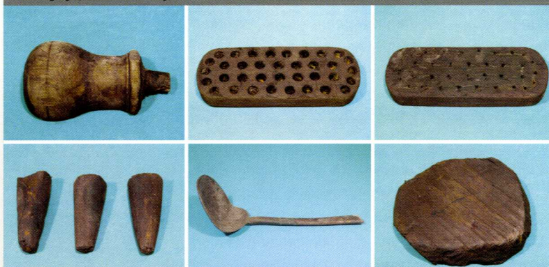
Handvat, handboender, houten stopjes, tinnen lepel, houten schijffe

De diverse 15e/16e eeuwse tonputjes die op het Statenplein zijn gevonden hebben vooral informatie opgeleverd over voedselresten. Zo nu en dan kwam er ook een kraaltje of een fraai bewerkt benen knoopje naar boven en wat keramiek. Het 17e/18e eeuwse tonputje aan de Varkenmarkt bevatte naast keramiek- en glasfragmenten (grape, bord, pispot, mineraalwaterfles) onder meer een tinnen lepel, houten borstels en enkele houten stopjes. De inhoud van de tonputjes van het Elfhuizenonderzoek moet nog worden onderzocht. In ieder geval is Dordrecht groot geworden op afval, zo bleek uit diverse opgravingen in de binnenstad. In het kader van de middeleeuwse stadsuitbreidingen werden drassige terreinen bouwrijp gemaakt door het aanbrengen van ophogingslagen (soms in bakken), die voor een groot deel bestonden uit (verzameld) afval.