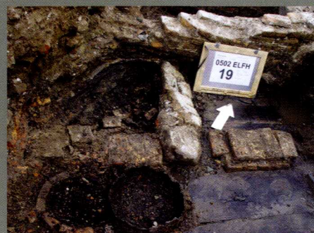
Ingegraven tonputjes (Elfhuizen 2006)

De diverse 15e/16e eeuwse tonputjes die op het Statenplein zijn gevonden hebben vooral informatie opgeleverd over voedselresten. Zo nu en dan kwam er ook een kraaltje of een fraai bewerkt benen knoopje naar boven en wat keramiek. Het 17e/18e eeuwse tonputje aan de Varkenmarkt bevatte naast keramiek- en glasfragmenten (grape, bord, pispot, mineraalwaterfles) onder meer een tinnen lepel, houten borstels en enkele houten stopjes. De inhoud van de tonputjes van het Elfhuizenonderzoek moet nog worden onderzocht. In ieder geval is Dordrecht groot geworden op afval, zo bleek uit diverse opgravingen in de binnenstad. In het kader van de middeleeuwse stadsuitbreidingen werden drassige terreinen bouwrijp gemaakt door het aanbrengen van ophogingslagen (soms in bakken), die voor een groot deel bestonden uit (verzameld) afval.