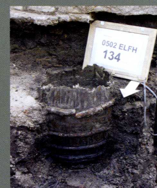
Tonputje (Elfhuisen 2006)

Bij middeleeuwse stadskernopgravingen worden vaak tonputjes, beerputten of -kelders gevonden in of bij huizen. Evenals mest- of afvalkuilen op een achtererf leveren die veel informatie op voor archeologen.