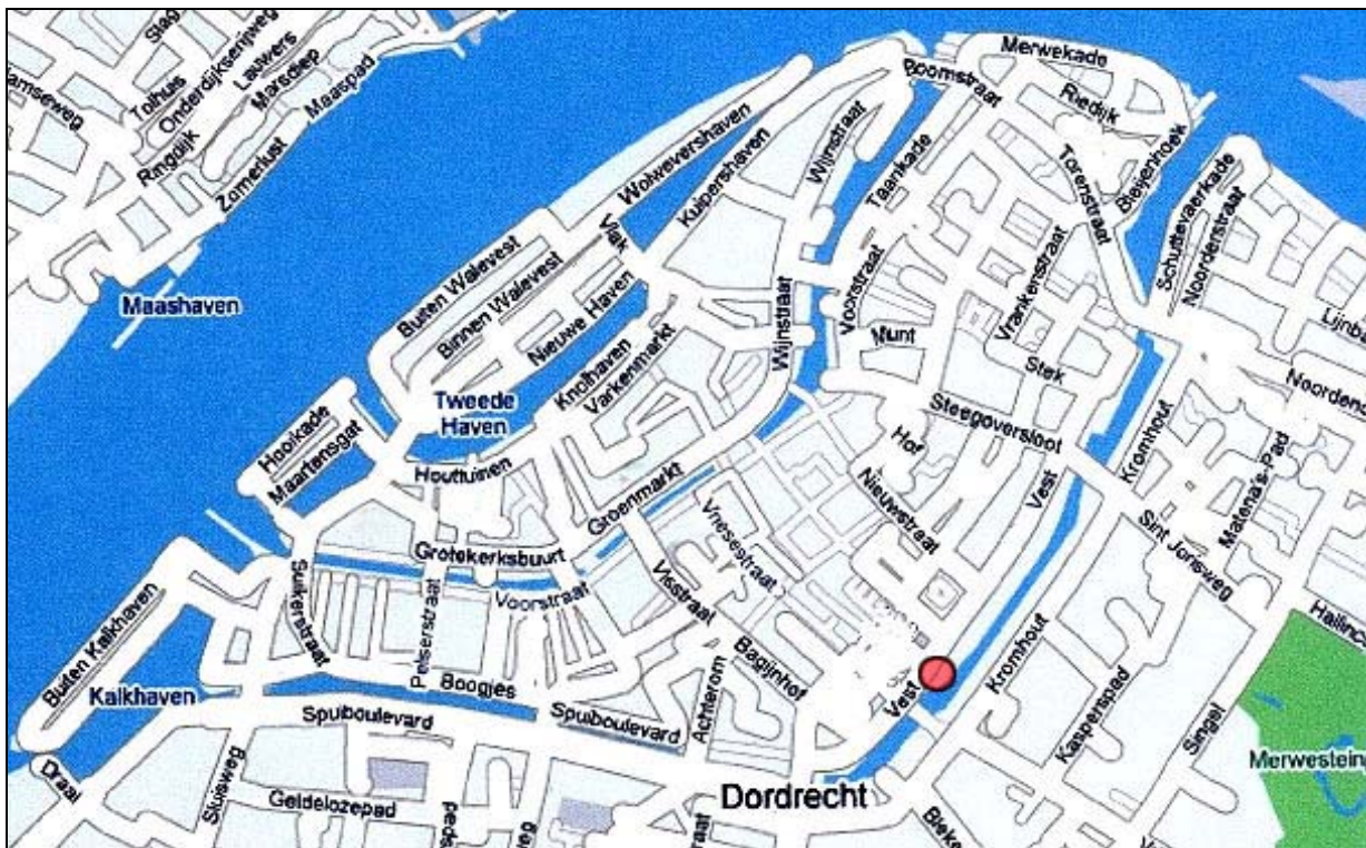
Afb. 1. De locatie van de onderzoekslocatie Vest 124 (rood).

Het plan- en onderzoeksgebied Vest 124 bevindt zich in Dordrecht en betreft een al jarenlang braakliggend perceel (afb. 1 en 2) pal tegenover de Korte Kolfstraat. Hier zijn graafwerkzaamheden uitgevoerd in verband met een beperkte bodemsanering en ter voorbereiding van het aanleggen van funderingen voor de nieuwbouw. Over het gehele perceel, ongeveer 5 x 20 m, werd hiervoor een laag grond met een gemiddelde dikte van 50 cm verwijderd. Alleen het laatste stuk van ongeveer 4 meter aan de zuidoostelijke zijde van het perceel grenzend aan het water van de Spuihaven werd dieper afgegraven. De maximale ontgravingsdiepte betrof daar ongeveer 1 meter. De centrumcoördinaten van het plangebied zijn X: 105.624, Y: 452.159. Tijdens de waarneming is vanwege de bekende bodemvervuiling gebruik gemaakt van beschermende kleding.