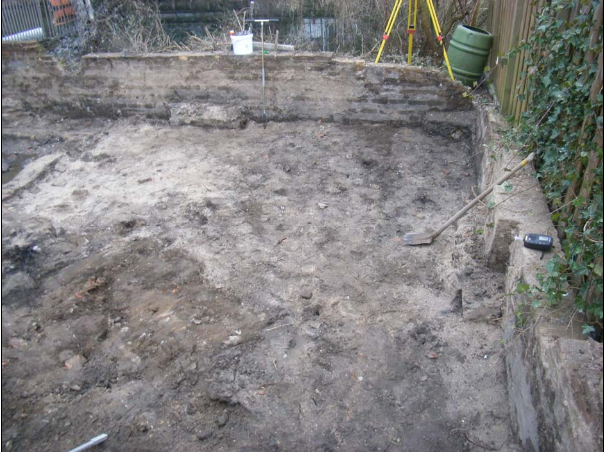
Afb. 3. Aanzicht ontgraving op de achterzijde van het perceel, met zicht op de muur aan de Spuihavenzijde. De maximale ontgravingsdiepte is hier bereikt. Rondom zijn de 20 e eeuwse muurresten zichtbaar.